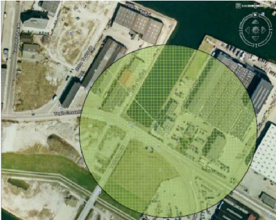
Figur 2- Beregnet konsekvensområde for indendørs kombineret luft- og strukturlydniveau L_{pA,LF} = 20 dB i 20 m høj bygning. Grænseværdiafstand ca. 150 m. Dæmpet skorstensafkast.

Vurderingen af lavfrekvent støj fra MAN's testmotor på Teglholmen bygger på beregninger af luftlyden og af strukturlyden. I følge rapporten vil den beregnede grænseværdiafstand plus et tillæg på 10 % betyde, at der er mindst 90 % sandsynlighed for, at støjgrænsen ikke overskrides. På den baggrund vurderer Center for Miljø, at grænseværdiafstanden for hhv. 30 dB og 20 dB skal øges med 10 %, så de bliver hhv. 55 m og 165 m fra testcentrets skorsten.