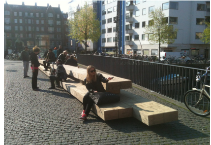
Bænken hvor skulpturen tænkes placeret i baggrunden. Her kan mennesker sidde i selskab med skulpturen og dens historie