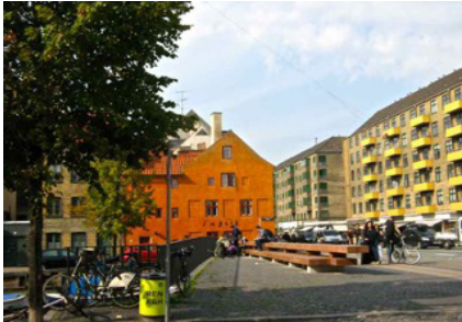
Børnehusbroen set fra Ovengaden Oven Vandet Skulpturen tænkes opstillet ved rækværket bag papirkurven