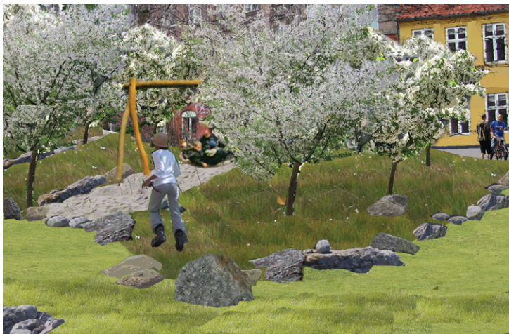
gyngemellem æble træer