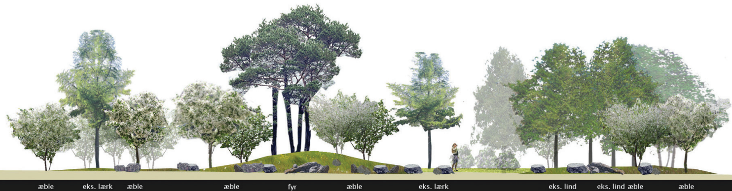
snit / opstalt - set fra Griffenfeldsgade