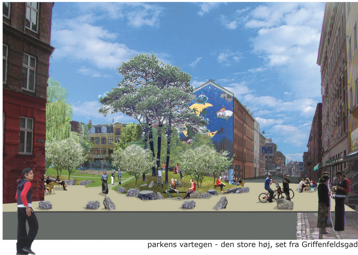
parkens vartegn - den store høj, set fra Griffenfeldsgade

Roser, kaprifolier og blomstrende urter på bakkerne og i revnerne mellem stenblokkene giver farve og duft om sommeren.