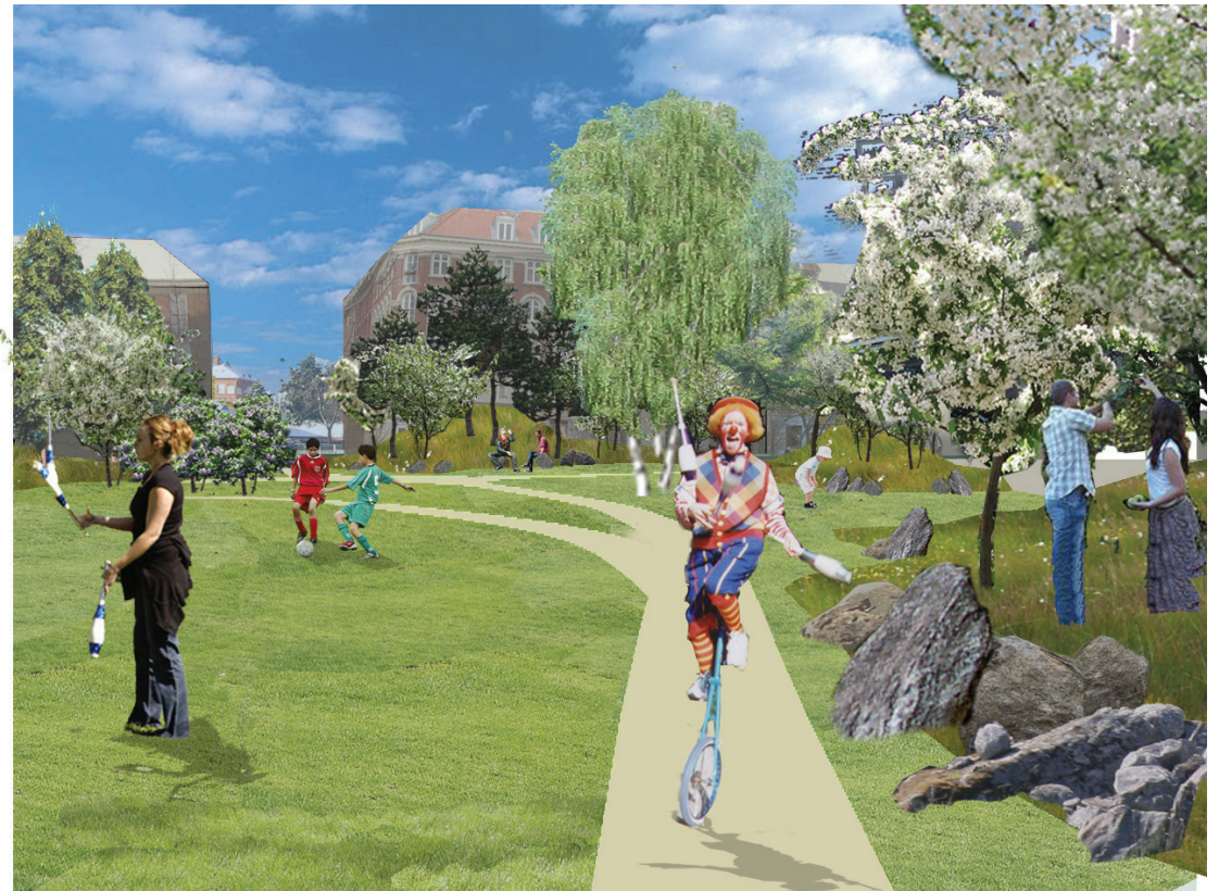
mulighed for forskellige aktiviteter på den store plæne

Der etableres en terrasse ud for Folkets Hus. Terrassen vil kunne bruges som udendørs værksted og den vil blive et naturligt mødested for husets brugere. Terrassen har direkte forbindelse til den store plæne og begge disse områder vil blive brugt ved koncerter og andre arrangementer i parken. Bålpladsen er placeret i parkens sydlige ende.