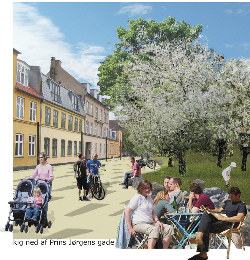
kig ned af Prins Jørgens gade

Der vil blive etableret ny belysning i Prins Jørgens gade.