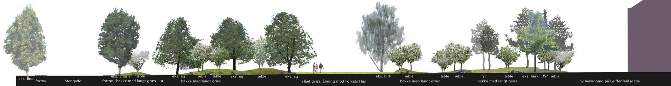
snit / opstalt - set fra Prins Jørgens gade