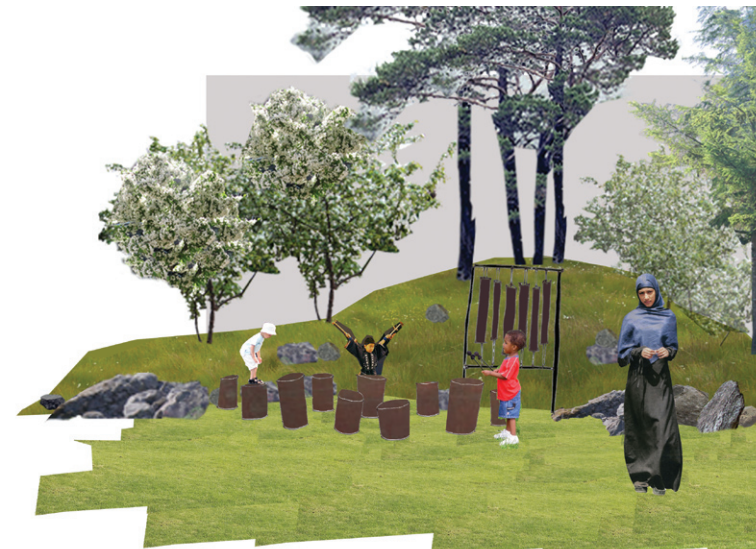
lydleg ved den store høj

Vi ønsker en levende park, der udvikler sig i takt med nabolaget og brugerne og forestiller os, at der etableres et brugerråd for parkens udvikling. Der gives plads i parken for brugernes deltagelse og lægges op til forandring og tilføjelser.