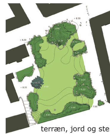
terræn, jord og sten