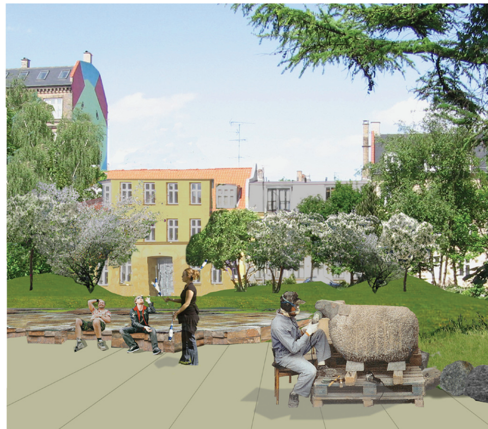
terrassen foran Folkets Hus

I det viste forslag er der allerede indbygget en ny finurlighed, det er Fuglereden. Vi har fundet et stort birketræ med tre tykke grene, som vil danne ramme om et plateau i træet. Et sted for børn og barnlige sjæle.