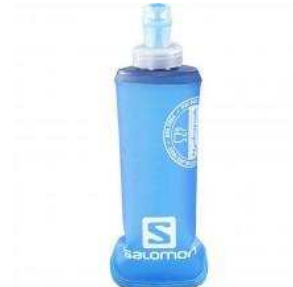
Salomon Soft Flask 250ml/8Oz kr 97.09 kr 70.95