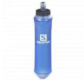
Salomon Soft Flask Speed 500ml kr 149.66 kr 105.45