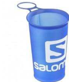
Salomon Soft Cup Speed 150ml kr 75.47 kr 53.95