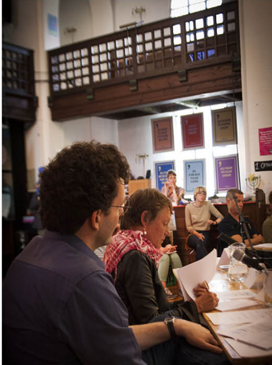
Fri Proces! i Gethsemane med stort fremmøde af vesterbroere i alle aldre.