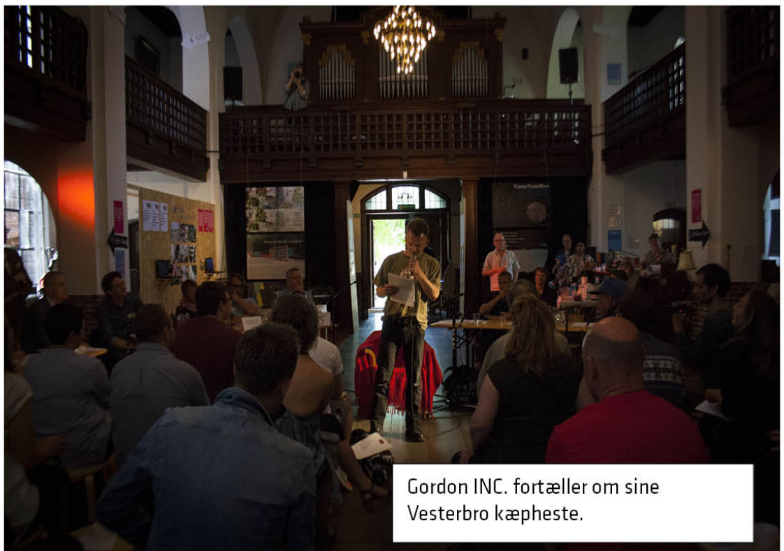
Gordon INC. fortæller om sine Vesterbro kæpheste.