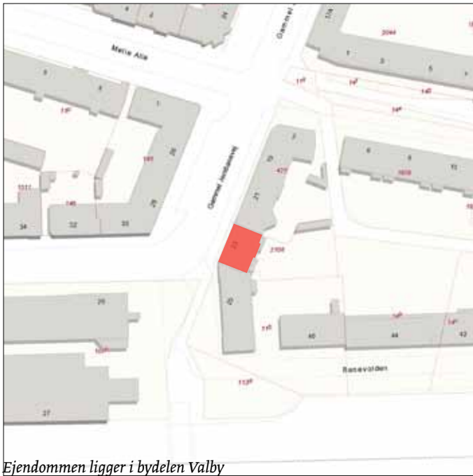
Ejendommen ligger i bydelen Valby