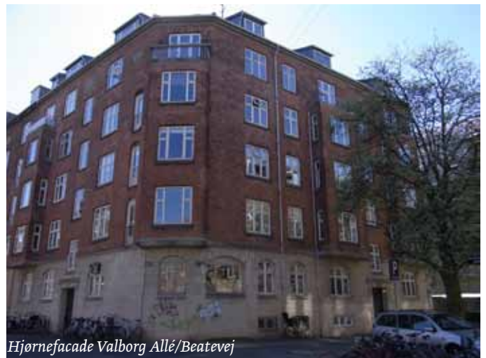
Hjørnefacade Valberg Allé/Beatevej