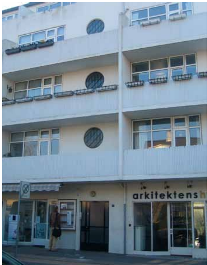
Facadeudsnit med erhverv