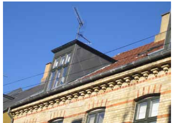
Indsatsområde Gl. Valby