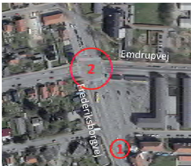
Oversigtsbillede af lokaliteten.