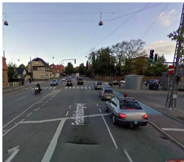
Placering på Frederiksborgvej syd for krydset med Emdrupvej, set mod nord.