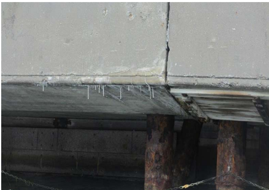
Revner i betonkonstruktioner med hvide udfældninger og drypsten