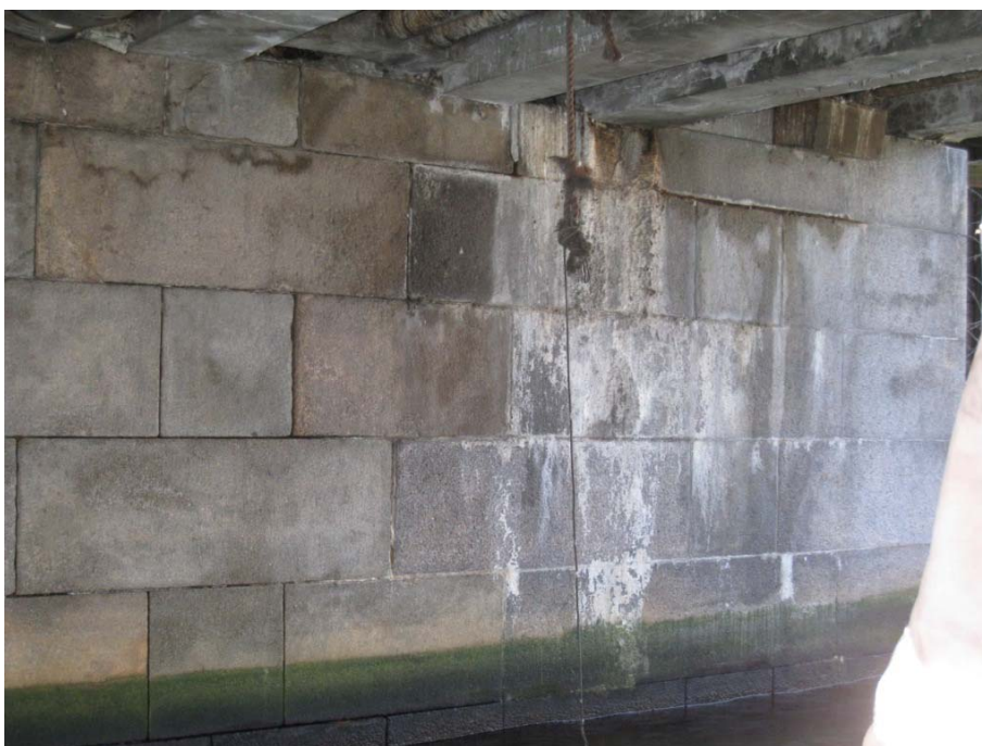
Gennemsvivninger ved vederlag og skader på betonkonstruktioner