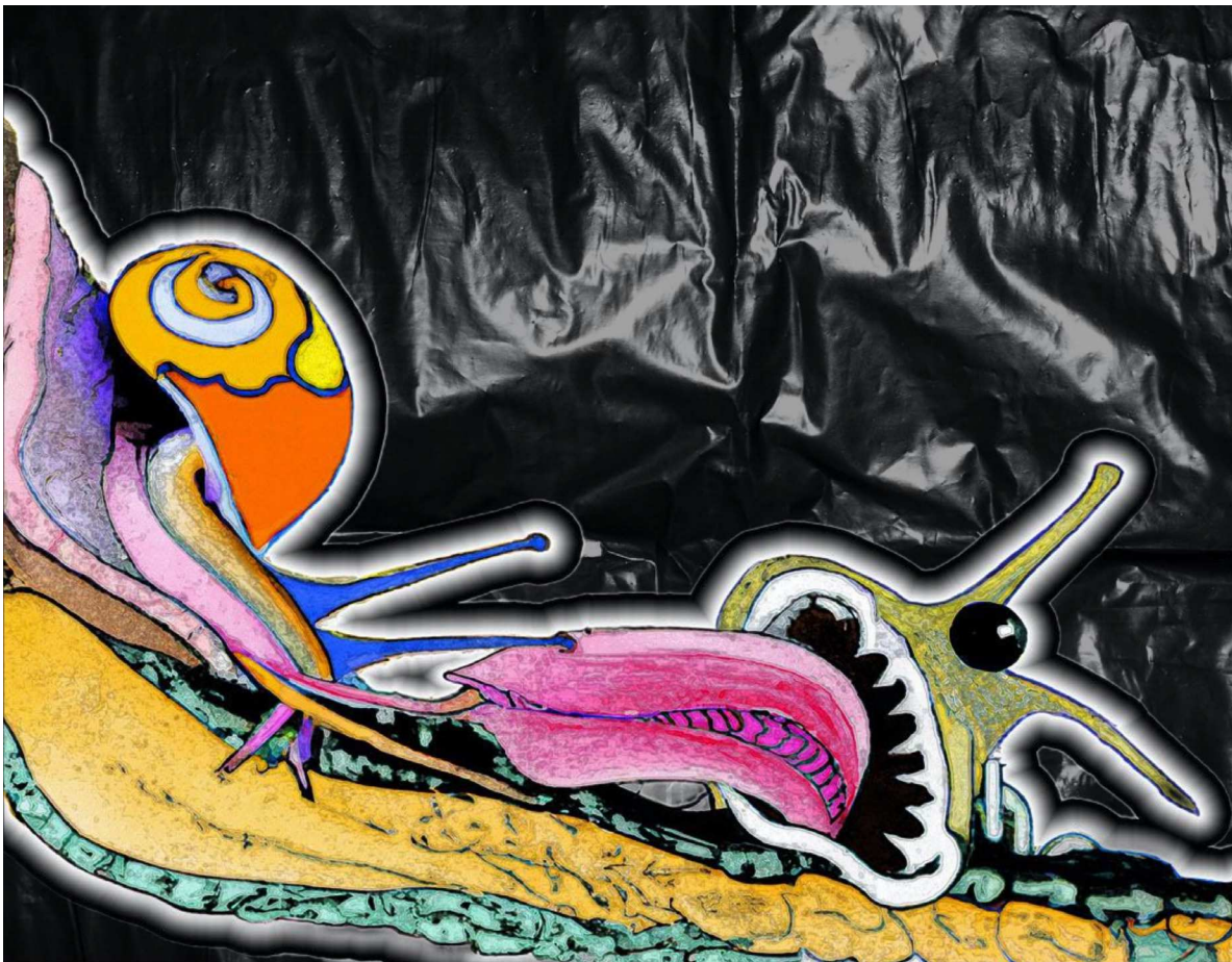
Grafik, Katya Elizarova, 2023.