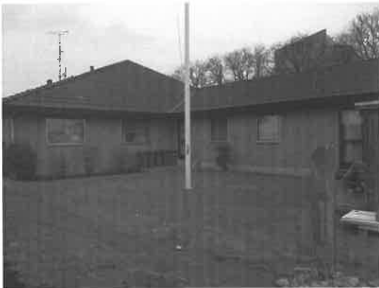
Fremad Amagers klubhus i dag.