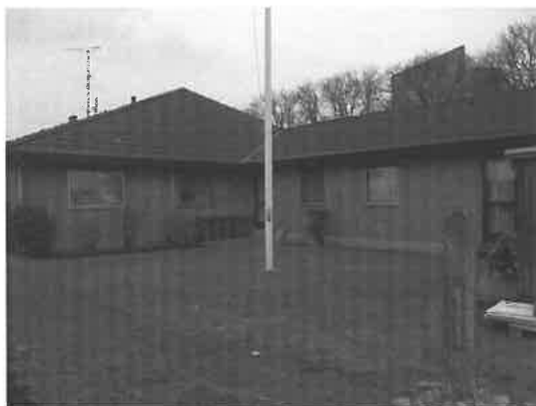
Fremad Amagers klubhus