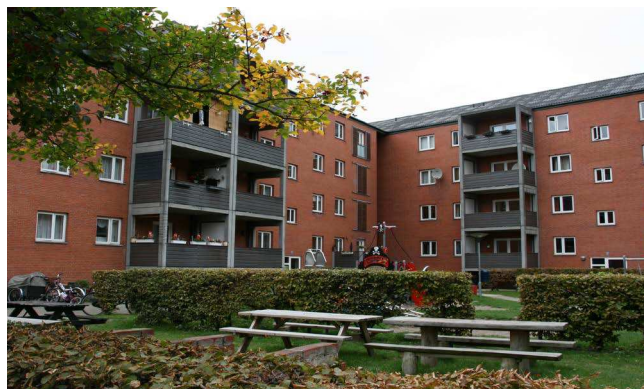
Bebyggelsen set fra gårdsiden.