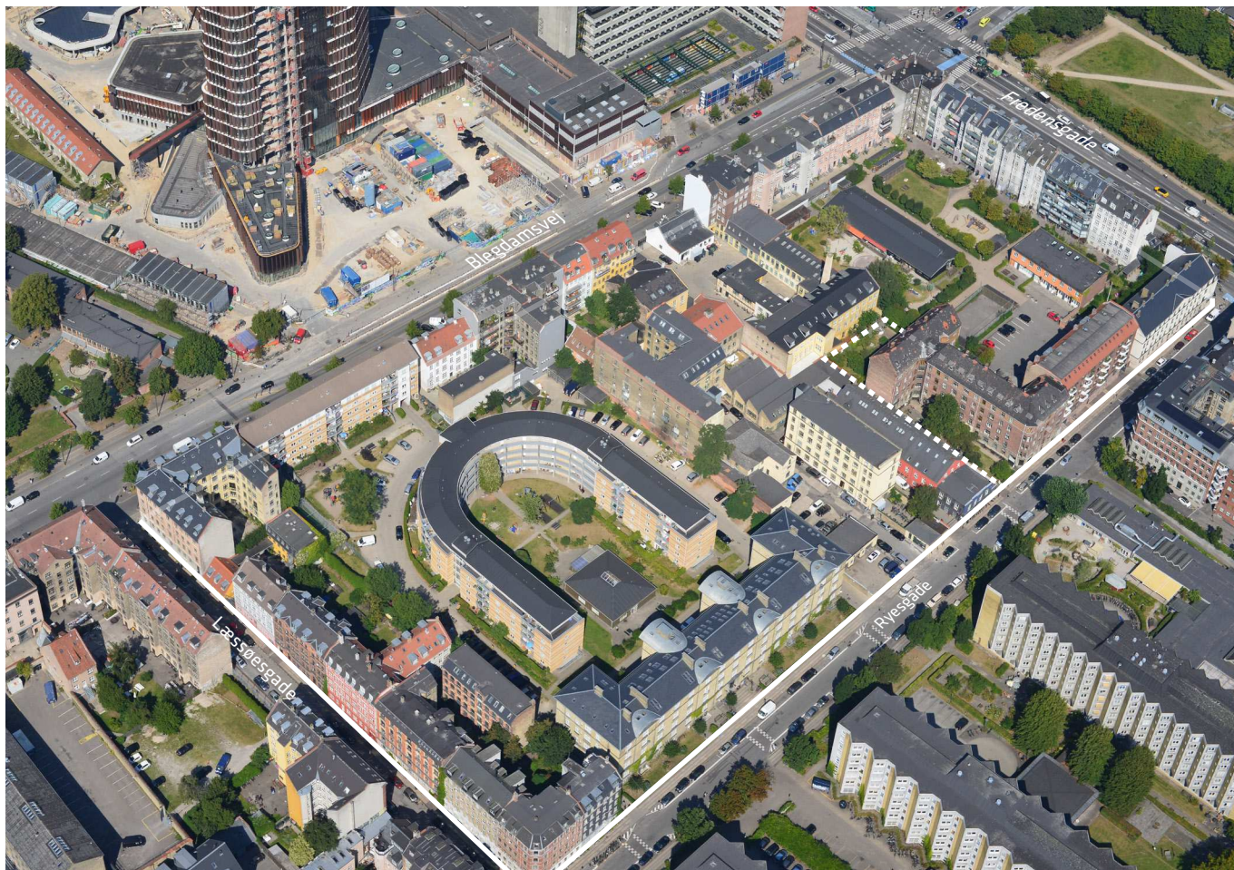
Luftfoto af området set fra syd. Lokalplan nr. 211 er angivet med hvid linje. Området for tillæg nr. 1 er angivet med hvid, stiplede linje.