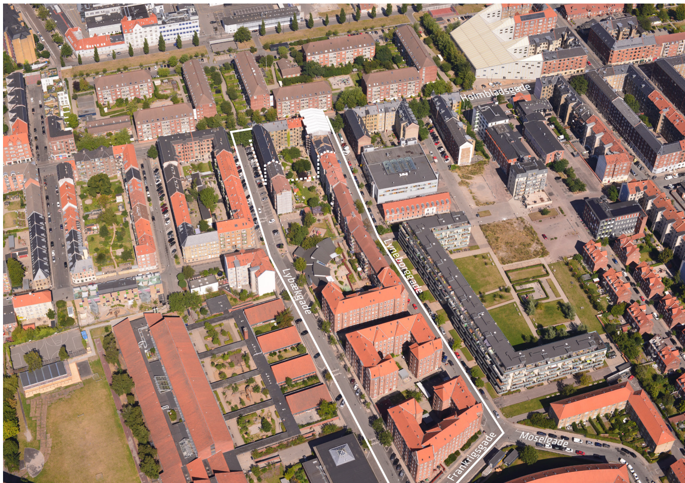
Luftfoto af området set fra syd. Lokalplan nr. 187 er angivet med hvid linje. Området for tillæg nr. 1 er angivet med hvid, stiplet linje.