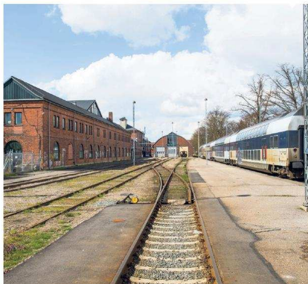
En lille, rolig lomme i København - Otto Busses Vej på jernbaneterrænet mellem Ingerslevsgade og Vasbygade. Fra bogen »Stille København« af Peter Olesen.

L ydtræppet på Solbjerg Parkkirkegård udgøres af susen i trætoppene, der - når man lukker øjnene - lyder lidt som havets brusen. Få meter borte buldrer Roskildevej ellers derudad med tung trafik og et støjniveau, som kan stresser selv en sommerferieudhvilet hjerne.