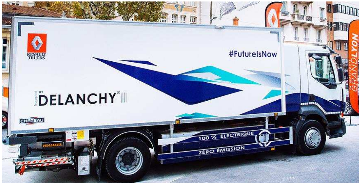
Renaults nye elektriske bylastbil