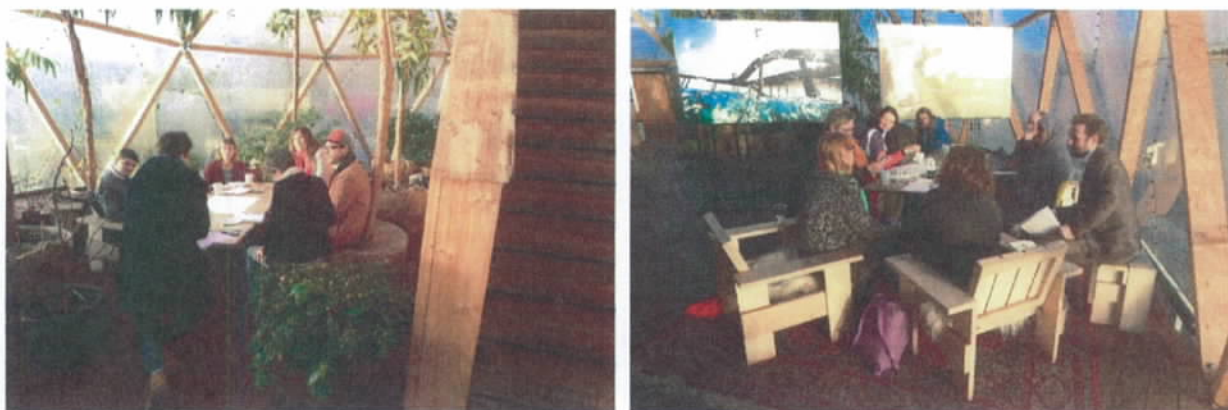
Figur 13 I 2015 afholdt Miljøpunktet en workshop om grønne livgivende steder i Indre by og på Christianshavn hvor aktører, som arbejder med bynatur, var samlet.

Som et samarbejde mellem Cultura21, Life Exhibitions og Miljøpunktet blev der d. 15. december afholdt en workshop i Dome of Visions. Formålet med denne workshop var at samle aktører, som på den ene eller den anden måde arbejder med bynatur. Deltagerne repræsenterede den lokale borger, den lille virksomhed, foreninger, Københavns Kommune osv.