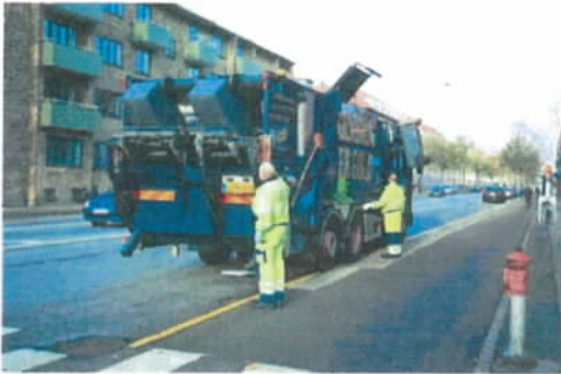
Figur 8 Miljøpunktet arbejder for bedre affaldssortering og genanvendelse bl.a. ved at bidrage til, at rygterne om at alt sorteret affald ender samme sted aflives.

Miljøpunktet har i forbindelse med diverse arrangementer ude i byrummet informeret om affaldsordninger og affaldssortering, blandt andet via konkurrencer. Dette har også bidraget til at aflive rygterne om, at alt sorteret affald ender samme sted samt fortællinger om, hvad der kan blive ud af det sorte affald. Mange tror, at fordi affald fra husholdninger i byen indsamles i samme bil, så havner affaldet også samme sted – hvorfor så sortere? Miljøpunktet har derfor fortalt om de separate rum i skraldebilen (tre-kammer-bilen), som netop sikrer adskillelse af det sorte affald helt frem til de forskellige modtageanlæg. Herved sikres det, at affald til genbrug også at blive genbrugt som en ressource frem for at ende som et spild.