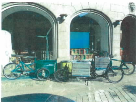
Figur 2 Hos Miljøpunktet kan familier og erhverv få lov at teste en ladcykel eller Longjohn i deres hverdag, hvis de går og overvejer at investere i en cykel.

Igen i år har Miljøpunktet udlånt ladcykler og Longjohns til testfamilier og erhvervsdrivende. Mange borgere i Indre by, ofte børnefamilier, går med tanker om at købe en ladcykel som erstatning for en bil. Med udlånsordningen gør Miljøpunktet det muligt at få afprøvet dagligdagen med en sådan cykel. Evaluering af udlån til testfamilier i 2015 foretages i 2. kvartal af 2016. Christianshavns Beboerhus har udlånt ladcyklerne fra dag til dag til borgerne.