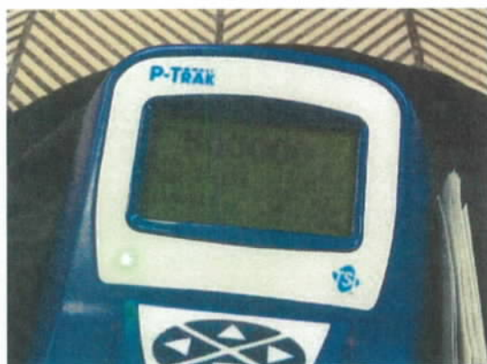
Figur 1 Hos Miljøpunktet er det muligt at låne en partikelmåler.

Derudover har Miljøpunktet udlånt centrets støjmåler til en lokal borger, som i en længere periode har været generet af metrobyggeriet. Han brugte målingerne til dialog med Københavns Kommune.