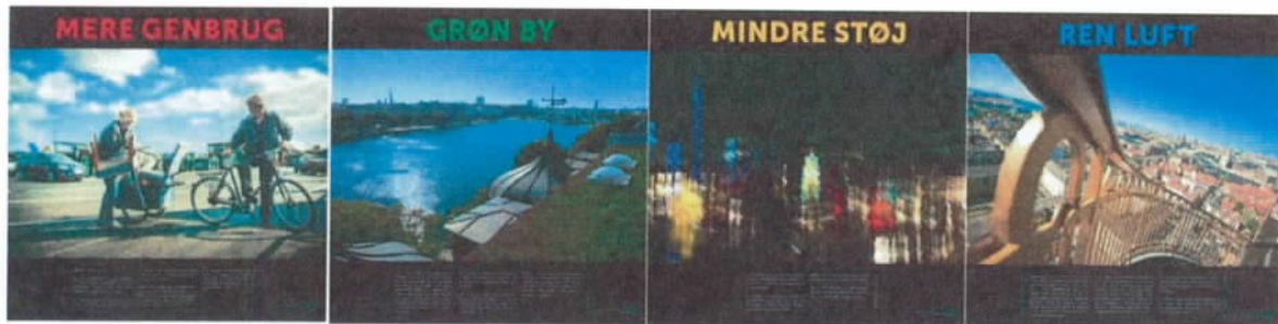
Figur 9 Fire nye plakater, som præsenterer indsatsområderne i årsplanerne 2015 og 2016, kan ses på Miljøpunktets kontor.

kampagne for ren luft i inde-miljøet) – en udstilling, som vi håber, vil få flere til at kigge ind og tænke over vigtigheden af og mulighederne for et godt, bæredygtigt indeklima. Endeligt har vi fået lavet fire plakater. Plakaterne viser de fire indsatsområder for Miljøpunktet, både i 2015 og i 2016.