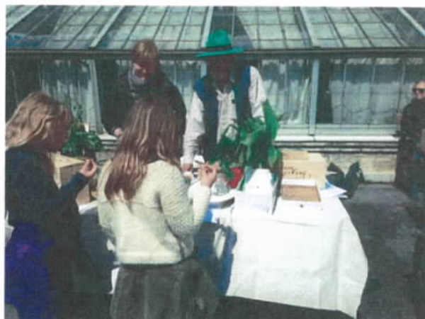
Figur 11 Presning af æblemost til Christianshavnerdagen 2015 samt information om vilde urter og smagsprøver af "Vild pesto" til Botanisk Haves Dag 2015.