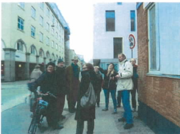
Figur 4 Gåtur med borgerne for at udpege mulige lokaliteter for plantning af flere træer.

For at støtte op om Københavns Kommunes kampagne 100.000 træer - København slår rødder har Miljøpunktet arrangeret tre grønne gåture for Københavns borgere. De to første ture blev afholdt i 2014, mens den sidste tur fandt sted d. 24. marts 2015. Formålet med disse ture var at nå ud til borgerne og høre deres ideer og forslag til, hvor der i deres lokalområde kan plantes mere grønt.