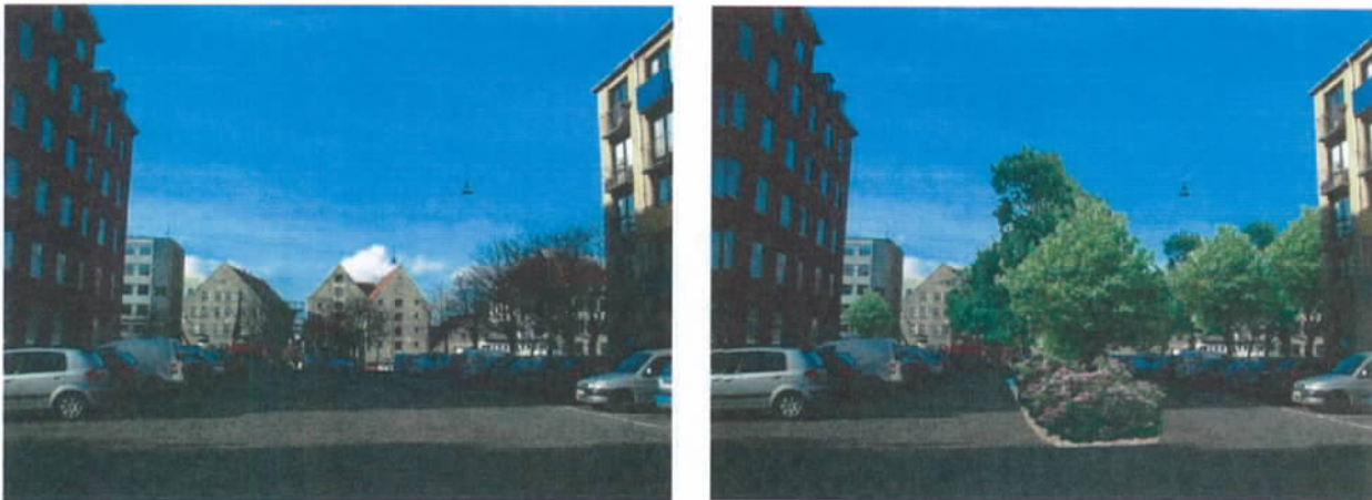
Figur 5 Forslag til begrønning af Bodenholms Plads efter ønske fra lokale borgere.

Rapporten er via Christianshavns og Indre By Lokaludvalg sendt til Teknik- og Miljøforvaltningen ved Københavns Kommune og kan også downloades via Miljøpunktets hjemmeside.