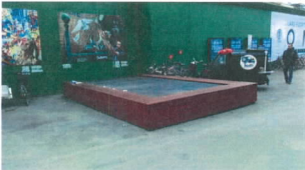
Figur 7 I 2015 fik Miljøpunktet bevilliget eksterne fondsmidler til at etablere et grønt tag på toppen af en endnu ikke færdig bygget elevatorskakt i forbindelse med Byens Hegn på Kongens Nytorv. Taget bliver anlagt ultimo april 2016.

I 2015 fik Miljøpunktet bevilliget eksterne fondsmidler til et grønt demonstrationstag i forbindelse med Byens Hegn på Kongens Nytorv. Demonstrationstagnet skal i samarbejde med Veg Tech etableres på toppen af en endnu ikke færdig bygget elevatorskakt ultimo april 2016. Dette giver borgerne mulighed for at komme og se og røre et grønt tag. Ofte er grønne tage placeret, så det kun er muligt at se dem på afstand, oppefra. Demonstrationstagnet skal ligge på Kongens Nytorv frem til ultimo juni 2016, hvorefter der etableres byggeplads på området. Miljøpunkt Indre By – Christianshavn har ifm. arbejdet med grønne tage og grønne facader oparbejdet kompetencer på områderne, som vi fremadrettet gerne vil dele med boligselskaber og – foreninger, som overvejer at investere i mere bæredygtige anlæg i deres ejendomme.