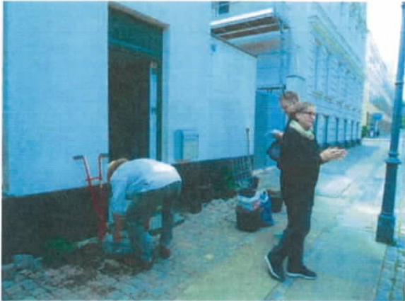
Figur 3 Den første facadebeplantning, støttet af Miljøpunktet i 2015, blev anlagt i Krusemyntegade.

sådanne beplantninger. I 2015 var det i to omgange muligt at søge om støtte hos Miljøpunktet til indkøb af materialer til facadebeplantning. To projekter blev igangsat i 1. kvartal (et i Indre by, Krusemyntegade og et på Christianshavn, Brobergsgade). Brobergsgade bliver først anlagt i 2016 grundet forsinkelse af renovering af facaden. Tre nye facadebeplantninger blev igangsat i 3. kvartal (to i Rørholmegade og en i Olfert Fischers Gade). Derudover er de tre facadebeplantninger, som blev igangsat i 2014, blevet etableret i løbet af 2015. Der forventes anlagt tre nye facadebeplantninger i 2016.