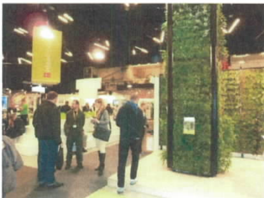
Figur 6 Netværket for grønne tage besøgte i 2015 for tredje gang Building Green, fagmessen for bæredygtigt byggeri.