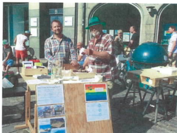
Figur 10 Miljøpunktet ønsker at være synlig i gadebilledet både på Christianshavn og i Indre by.