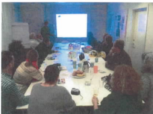
Figur 12 Netværket af borgere med interesse for kompostering i byen samles og udveksler viden og erfaringer.

I 2015 afholdt Miljøpunktet d. 3. marts et netværksmøde for borgere med interesse for kompostering.