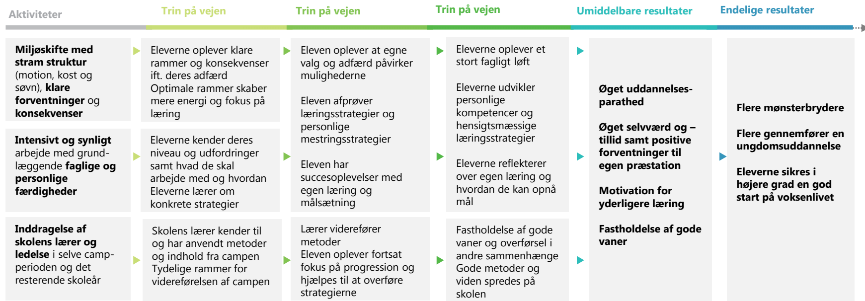
Illustration af sammenhæng mellem aktiviteter i læringsforløbet og forløbets mål:

Inddragelsen af skolens lærere og ledelse har til formål både at skabe tryk blandt eleverne i campperioden og at sikre overlevering og fastholdelse af viden og metoder fra campperioden til elevens efterfølgende forløb i skolen. Derudover kan skolens lærer anvende brugbare metoder og læring i andre undervisningssammenhænge samt sprede dem til andre undervisere på skolen. Således kan lærerens deltagelse i campen skabe værdi for andre elever og lærere på skolen. Den efterfølgende undervisning på egen skole skaber tydelige rammer for videreførelsen af læringen på campen og skal være med til at fastholde eleverne i den gode udvikling samt hjælpe dem med at overføre strategierne til andre sammenhænge.