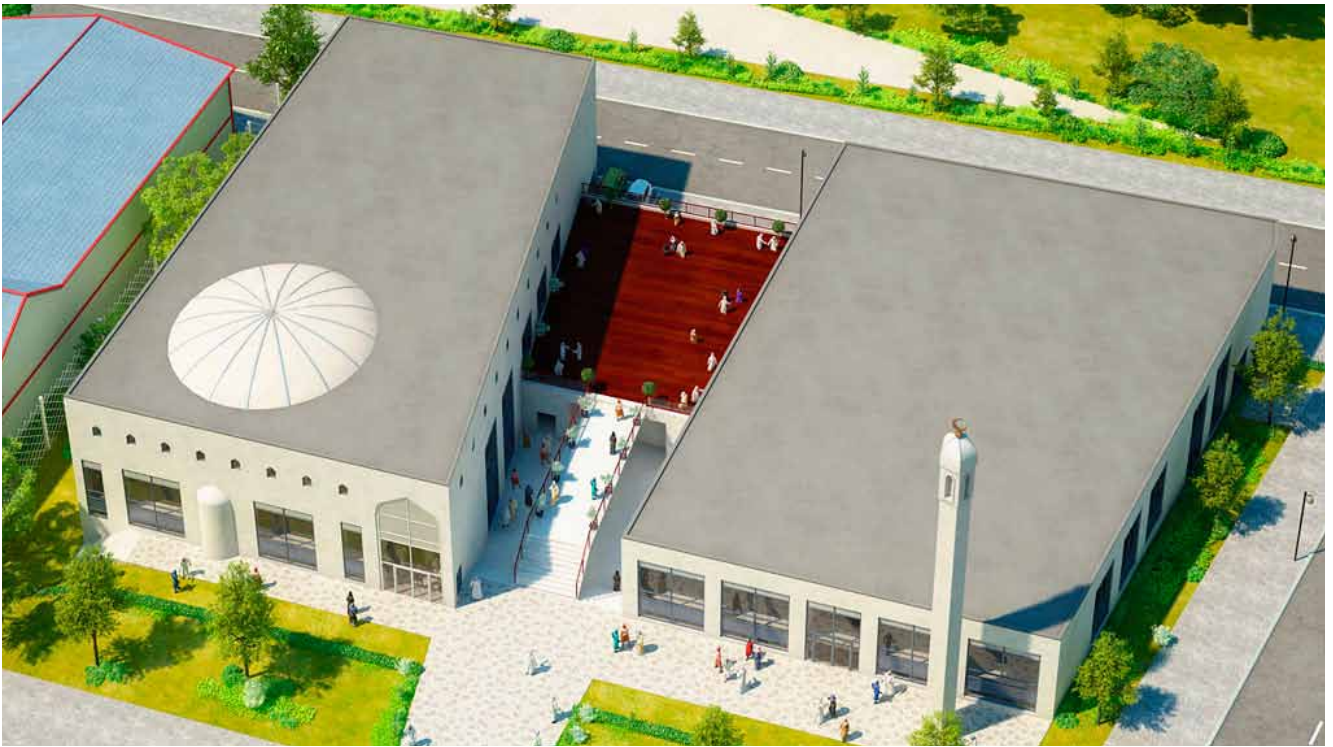
3D-illustration af projektet