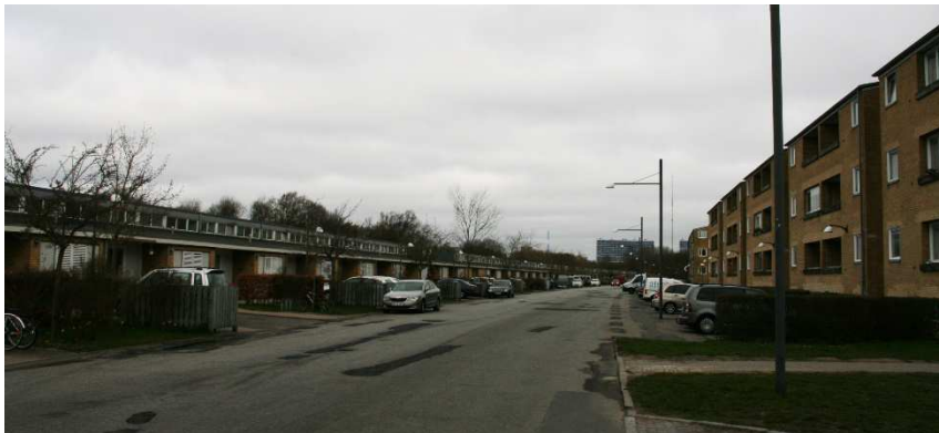
Rækkehuset set fra syd langs Langhusvej

Bygningen er i sig selv en flot og markant bebyggelse, men adskiller sig i bygningsform, og i placeringen i den vestlige udkant på den anden side af en bred vej fra den øvrige bebyggelse, så den forekommer ikke at være helt så integreret i bebyggelsen, og samtidig med at den afgrænser bebyggelsen spærrer den delvis også for udsyn og adgang til bagvedliggende grønne områder, hvortil der kun er adgang via et par gennemgange.