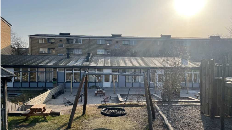
Bygningens vestfacade med den karakteristiske facadebeklædning og højformater.

mindre synligt i gadebilledet, mens bygningen er i niveau med det grønne areal mod vest.