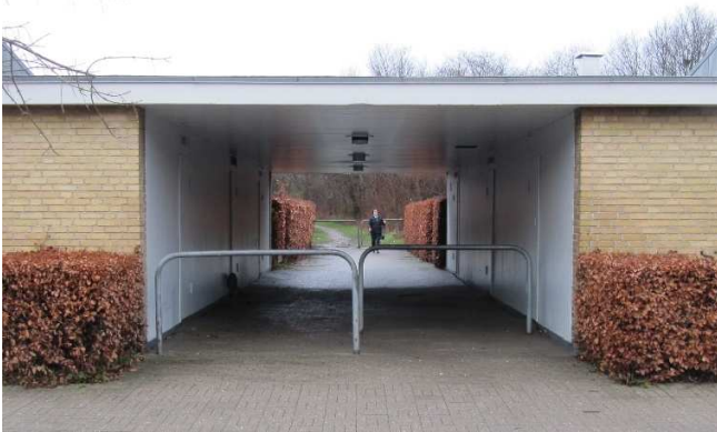
En af de to gennemgange fra Langhusvej til de grønne arealer