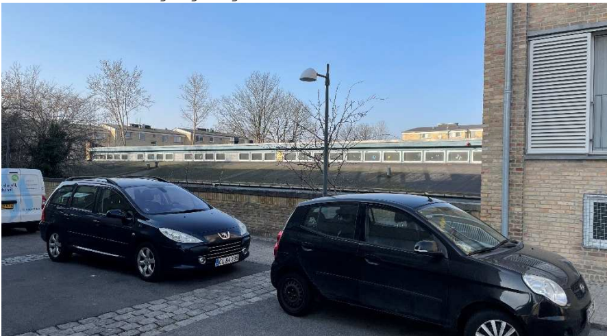
Mod øst ligger bygningen sænket og tilbagetrukket i forhold til gaden