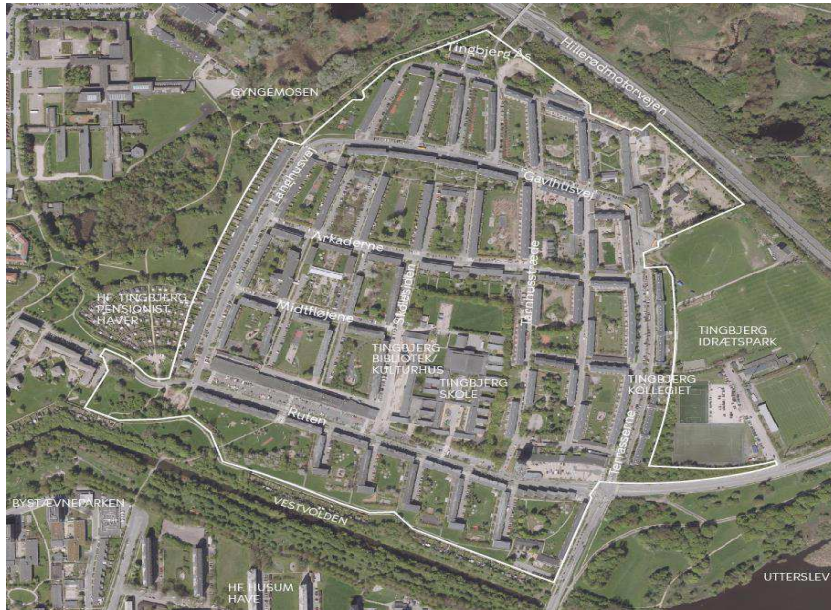
Luftfoto af Tingbjerg med lokalplanafgrænsningen markeret med hvidt.

Vejbetjening sker med et net af veje, der via et ringvejssystem (Ruten-Terrasserne-Gavlhusvej-Langhusvej) er koblet til det overordnede vejnet. For at undgå en monoton bydel har Steen Eiler Rasmussen søgt at gøre vejene så karakterfulde som muligt. Dette er løst ved at differentiere gadenettet, så hver vej og gade er udformet efter sin specielle placering og funktion inden for området, og ved at vejene krummer.