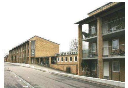
Arkaderne mod øst med en 1-etages institution

Tingbjerg er opført på grundlag af en bebyggelsesplan udarbejdet i 1950 af Arkitekt Steen Eiler Rasmussen i samarbejde med havearkitekt C. Th. Sørensen. I 1956 påbegyndtes byggeriet og størstedelen af bebyggelsen var færdigopført i 1970. I 2018 er der opført et kulturhus tegnet af arkitektfirmaet COBE. Bygården mod Ruten stod i medio 2020 færdigbygget med butikker og private boliger på det førhenværende Lille Torv.