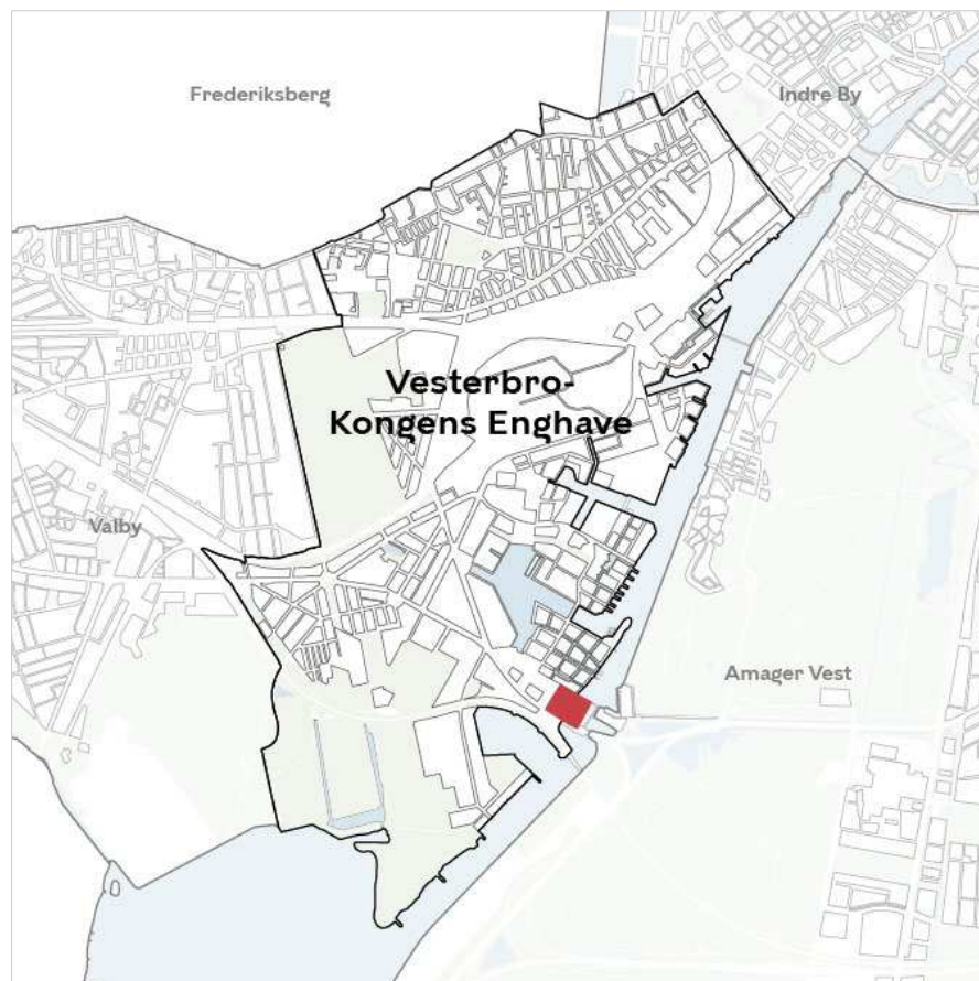
Områdets placering i bydelen.

Projektet ønskes opført på 'Nauticon-grunden', Sjællandsbroen 21.