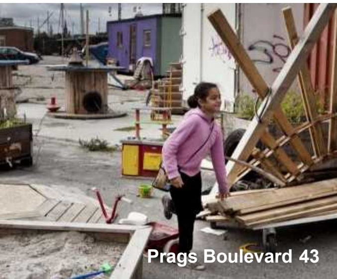
Prags Boulevard 43