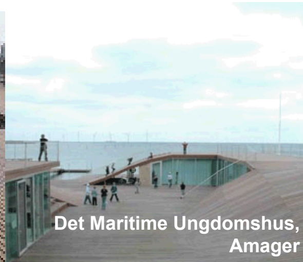
Det Maritime Ungdomshus, Amager