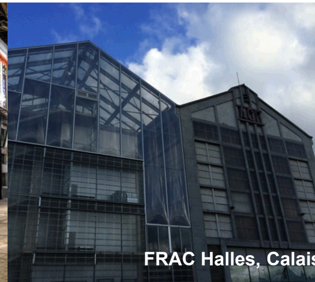
FRAC Halles, Calais