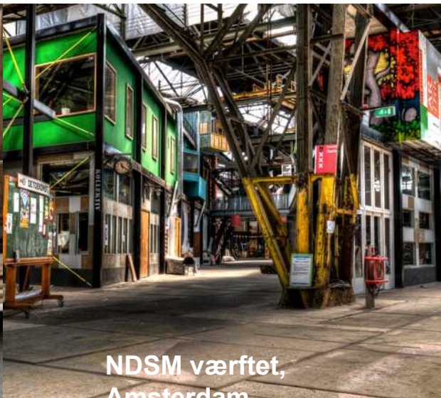
NDSM værftet, Amsterdam