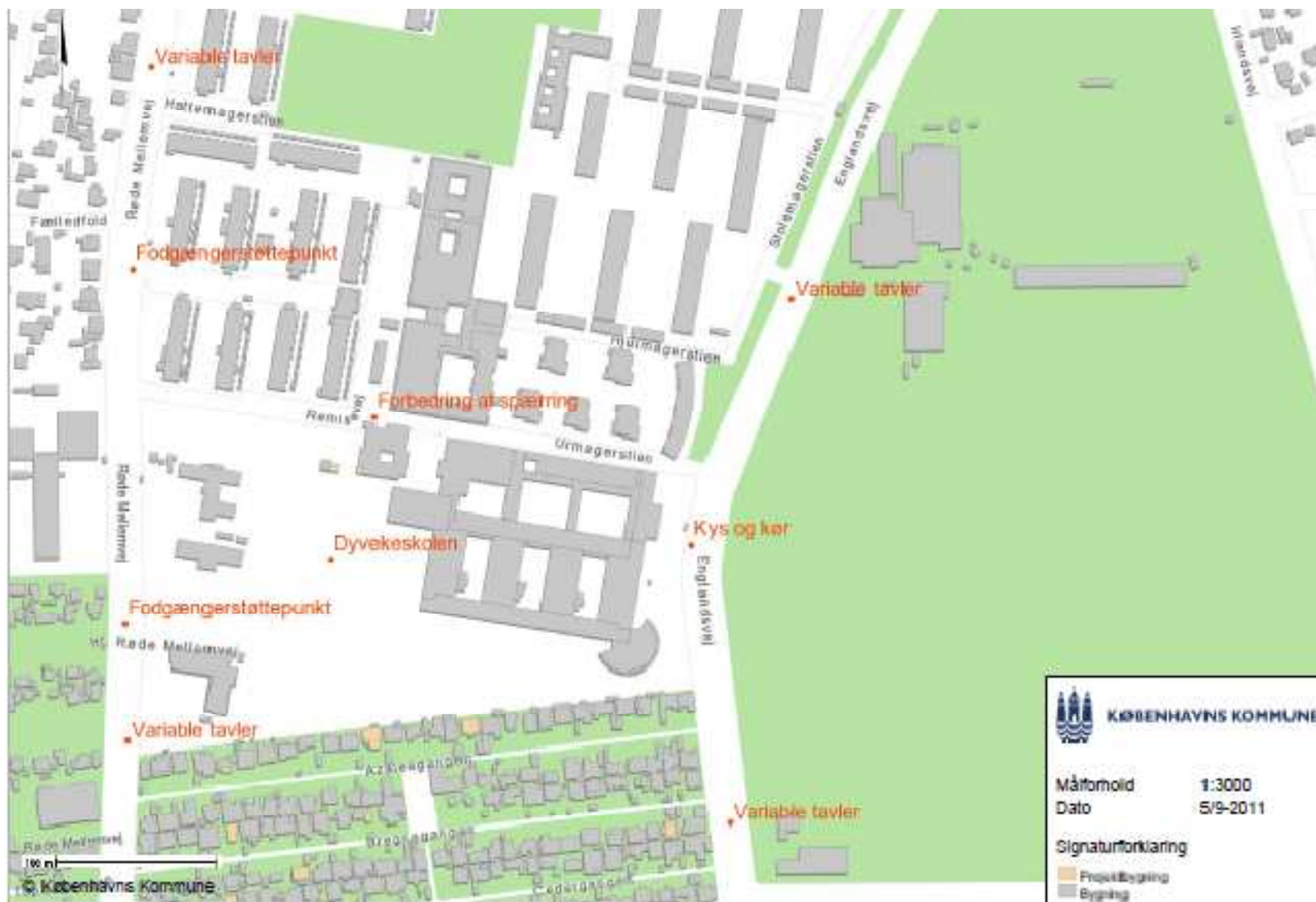
Dyveke skole: Forslag til placering af løsninger ved Dyveke Skole.