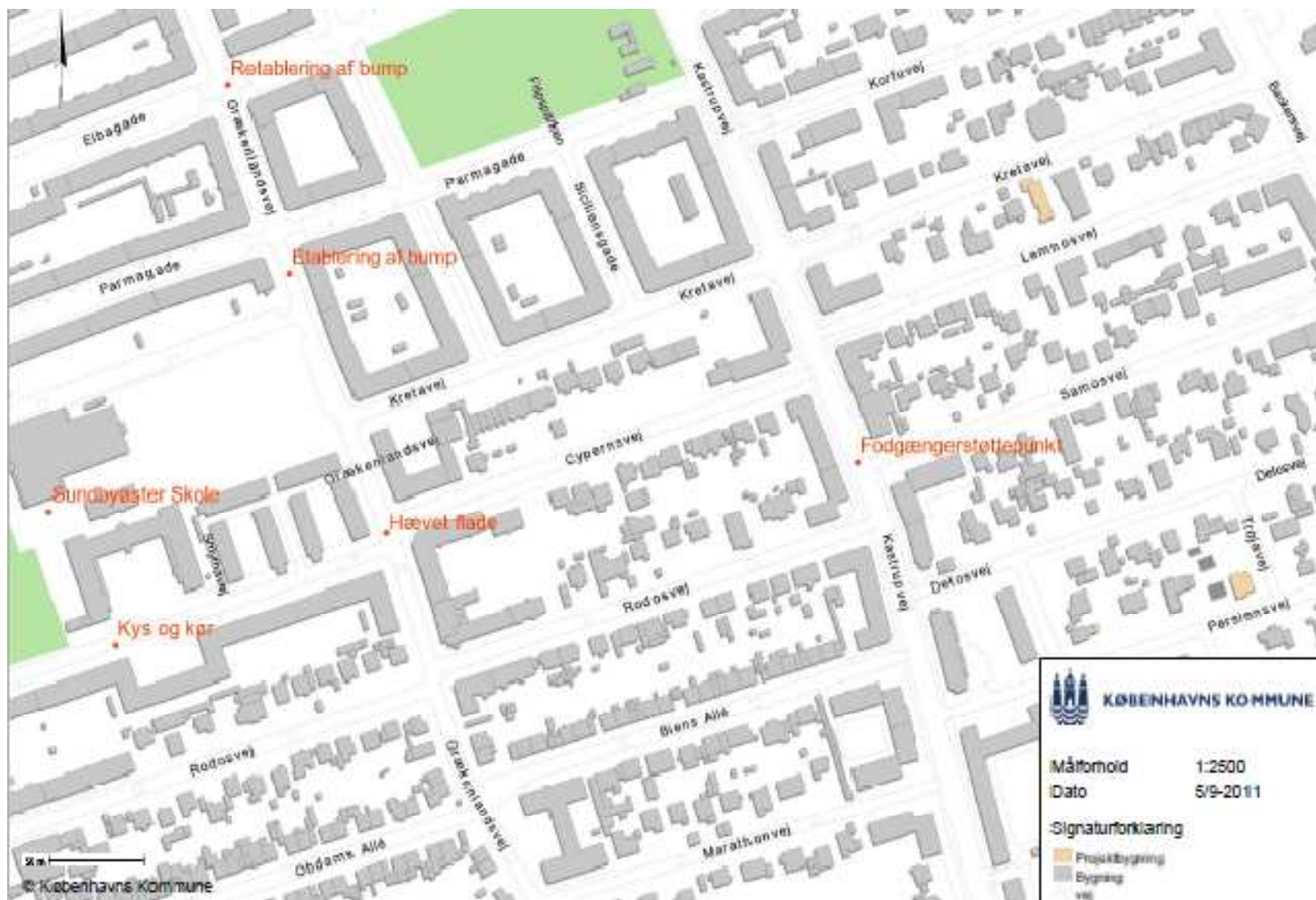
Sundbyøster Skole: Forslag til placering af løsninger ved Sundbyøster Skole.