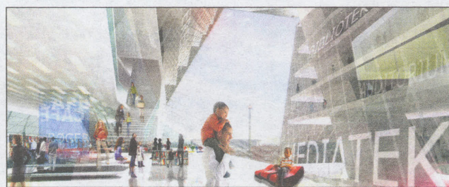
Projektet der forblev en drøm. Henning Larsens tegnestue forestillede sig i 2007 et 80 meter højt svar på Pompidou-centeret i Paris, en bygning med to plateauer med udsigt over København. (Ill: HLA)

- Generelt kan man sige, at der er interesse i at fortætte et stationsområde, det er med til at skabe en bæredygtig og mere intens bydel, men højhusarkitektur er en særlig disciplin, der kræver megen stillingtagen til, hvad