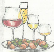
Tegning: Roald Als

»Vi forsøger gennem samarbejde med andre at nå hurtigere til målet, der handler om at nedbringe CO 2 -udledningen, tilpasse vores byområder til klimaforandringer og drive vores forsyningsvirksomhed så omkostningseffektivt og fremsynet som muligt.