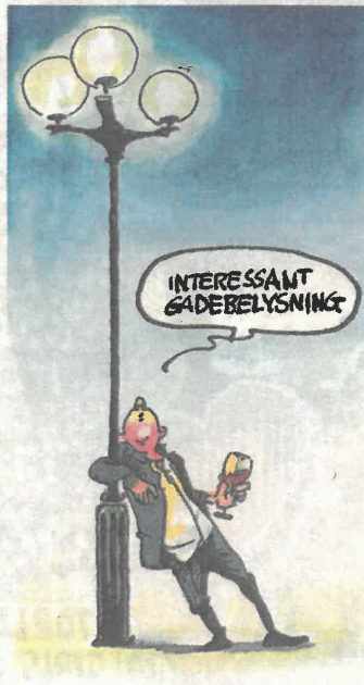
Tegning: Roald Als

»Det har givet os en masse inspiration til, hvordan vi fremadrettet skal passe på vores ting herhjemme, hvad vi kan gøre anderledes, og hvem det kan være interessant at snakke med. Hvis vi som selskab vurderer, at der er et særligt interessant område, sender vi gerne folk af sted for at blive klogere«, siger direktøren, der mener, at inspirationsture er med til at klæde ledelsen