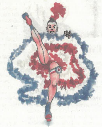
Tegning: Roald Als

»Nogle gange rejser vi ud for at blive bekræftet i det, vi gør herhjemme, eller for at få finpuleret det, vi gør, set i perspektiv med resten af verden. Når vi tager på studietur er det for at perspektivere det, som vi arbejder med til daglig, og meget ofte har vi fået fantastiske ideer med hjem, som