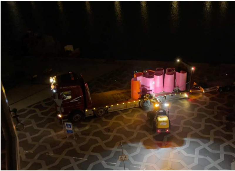
02.30 opstilling af toiletter