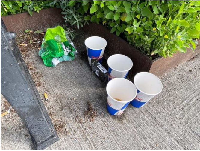
Er du tørstig?