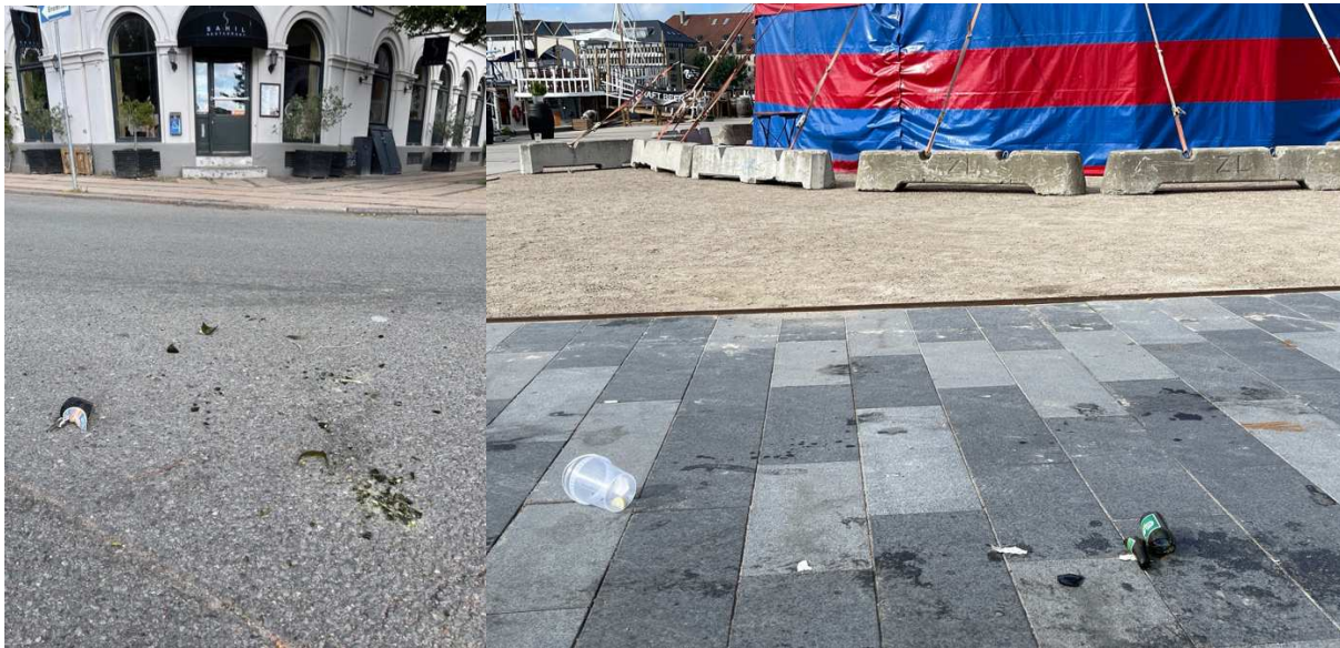
Glasskår dagen derpå