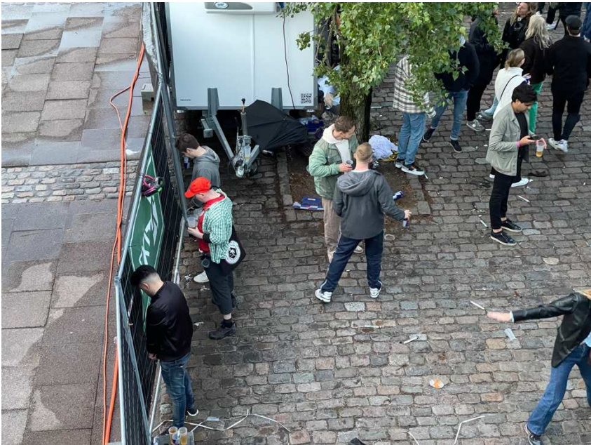
Lettere at pisse i hegnet