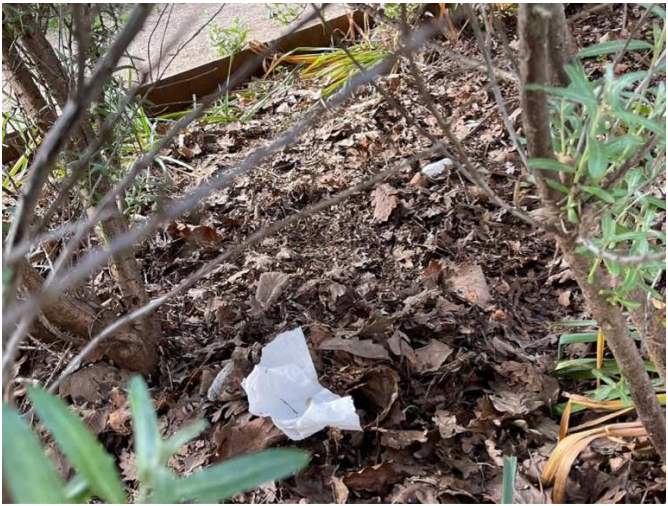
Toilet i buske på Havnegade