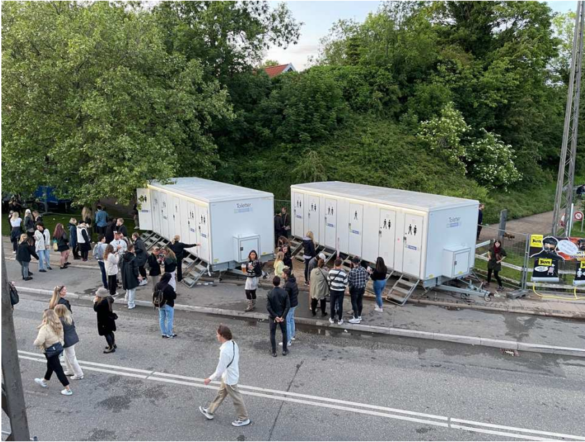
Ingen toilet kø