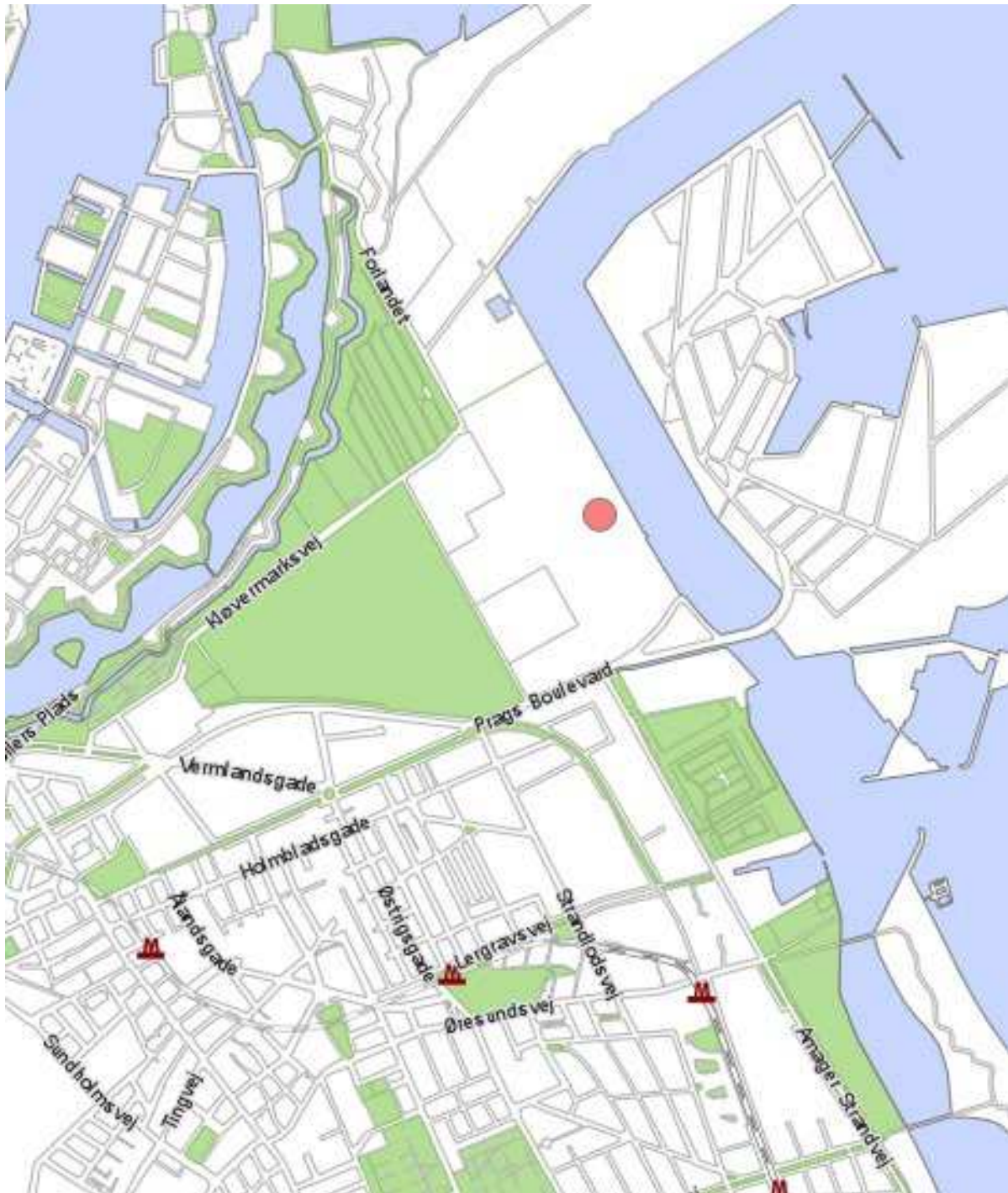
Kløverparken – Prags Boulevard 71.