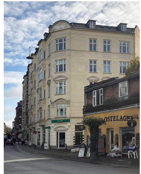
Mødet mellem landsbyen og karrébyen, set fra Valby Långgade

Ved at ændre den asfalterede overflade til gårdrum med en højere andel beplantning og ved at delvist beplante de nye tage, bidrager projektet til at optage regnvand lokalt og belaste kloaknettet i mindre grad.