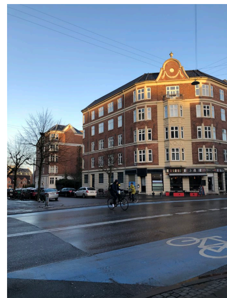
Karrébebyggelse på Mølle Allé i røde tegl, set fra Toftegårds Allé.