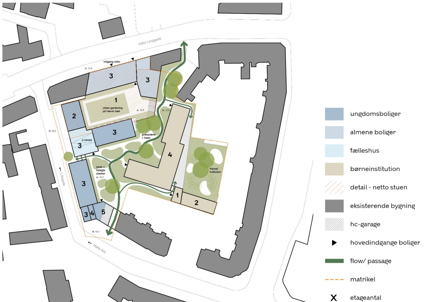
Situationsplan med anvendelser angivet for stueetagen.