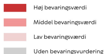
Bevaringsværdige bygninger i området