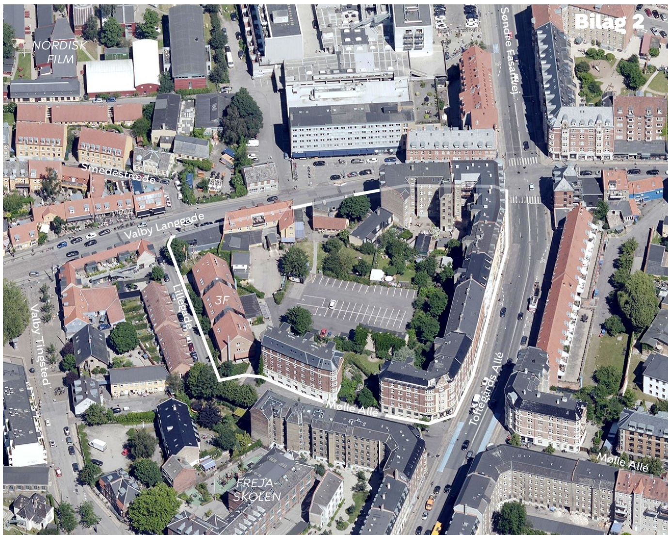
Området set mod nord. Lokalplanområdet er indtegnet med hvid linje og de vigtigste gader, pladser og bygninger er navngivet.