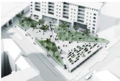
1. Bydeless torv med hældende flader til ophold og cykelparkering