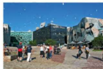
Reference på stor plads

Der har blandt borgere og brugere af byrummene på Nørrebro og Nordvest, været et klart ønske om, at beholde Basargrunden, som det store åbne areal, byens torv. Det skal være stedet, hvor der er plads til loppemarked, basar eller større kulturelle events. Men den store åbne plads har også sin udfordring: hvordan afskærmes det for trafikken, hvordan ledes de bløde trafikanter over pladsen, og hvordan sørger vi for, at det ikke bliver et stort rod af cykelparkering?