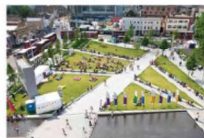
Reference på stor plads