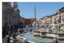
Reference på stor plads