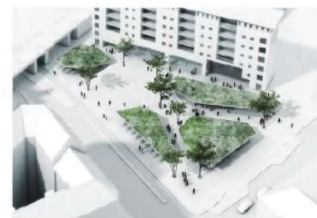
3. Overdækket torv med grønne svævede overdækninger

I en tredje løsning ændres fladerne og bakkerne til overdækkede pavilloner, der kan bruges til cykelparkering, ophold, cafeer eller en mere permanent basar, som Basargrunden har været tidligere.