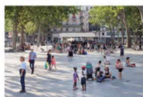
Reference på stor plads