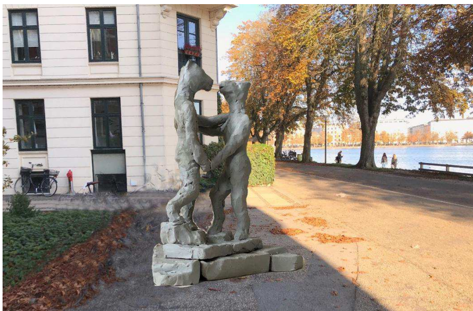
(skulpturen figurerer på billedet lidt større end svarende til de ca.1,70m figur højde)

Placeringen passer også rigtig godt ift hvor de eksisterende skulpturer er placeret og disses temaer.