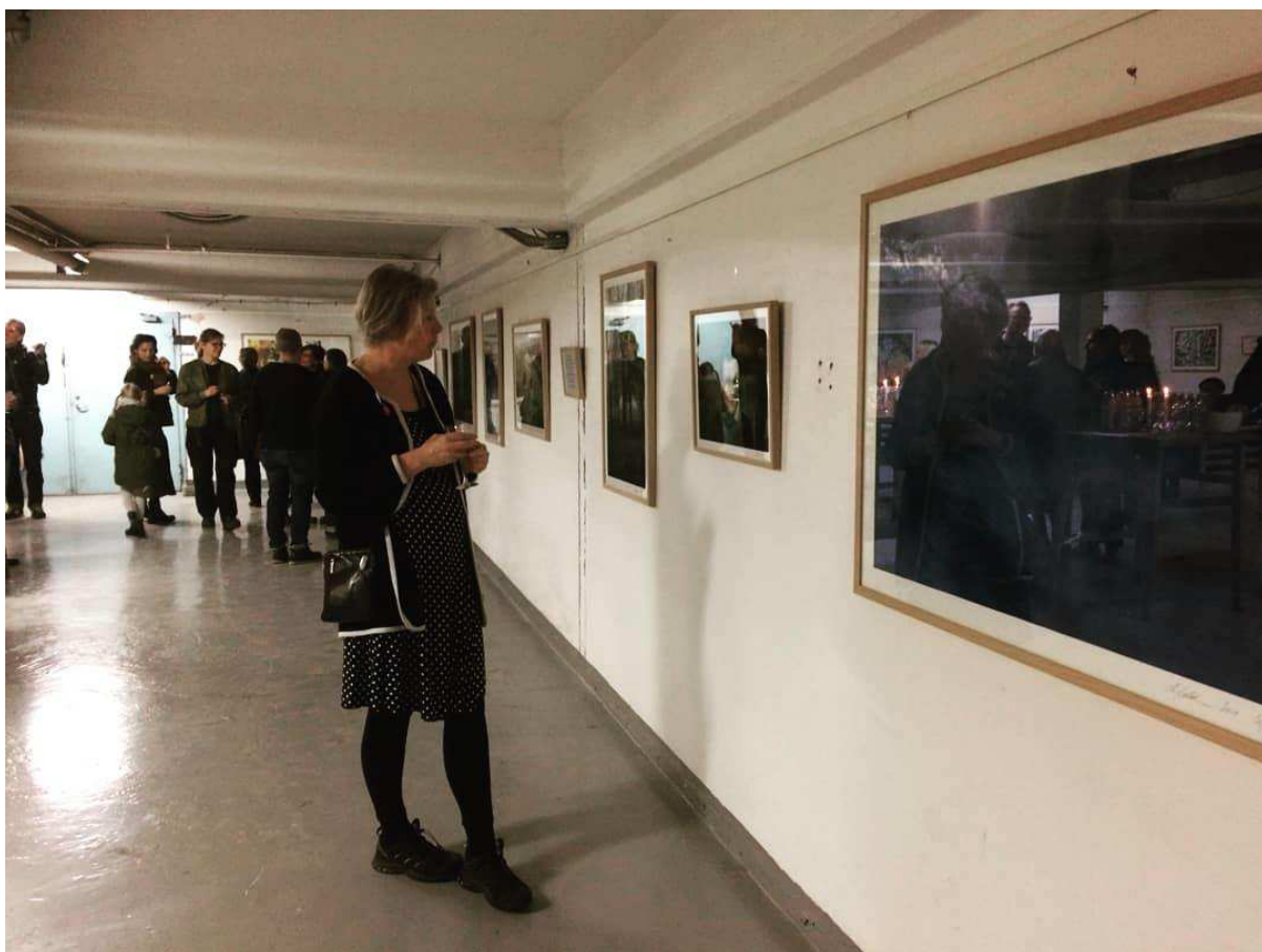
Udvalg af værker af Nikolaj Callesen, der vil blive præsenteret på galleriets vægge ved udstillingen "Echo" - maj – juli 2022.: