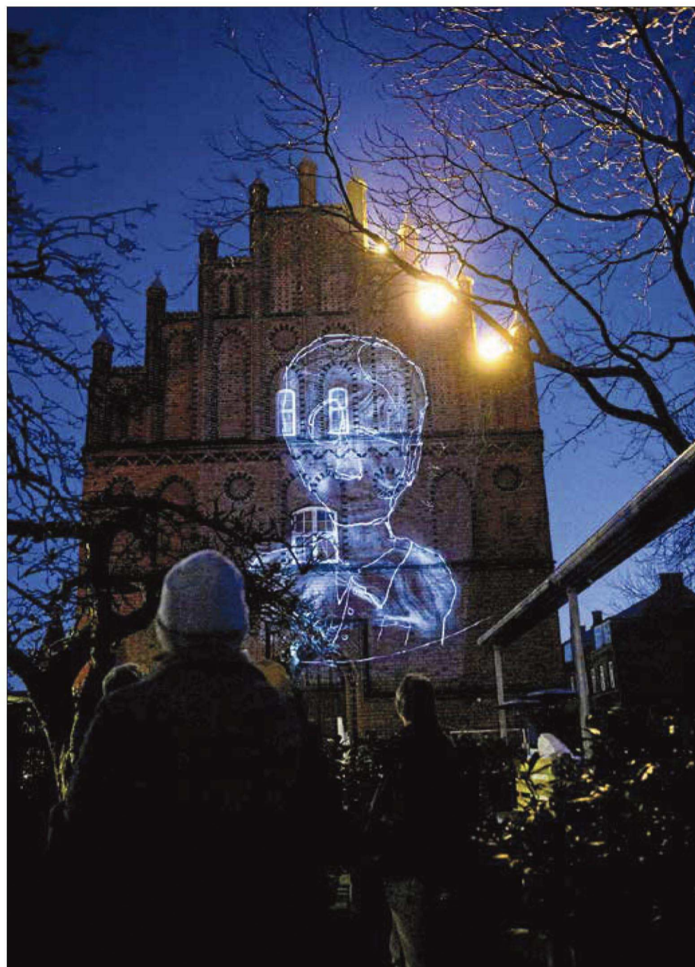
Gavlen på Byens Hus udgør det største »lærred« for »Coronarefleksioner.«

Samtalerne, en del af lydsiden består af, er optaget