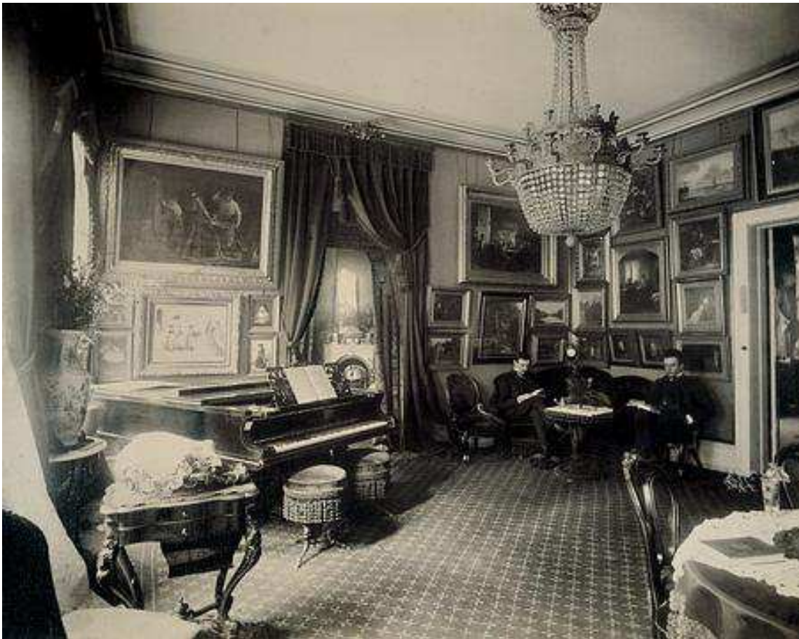
Stuen hjemme ved Hirschsprung-familien i Bredgade i København