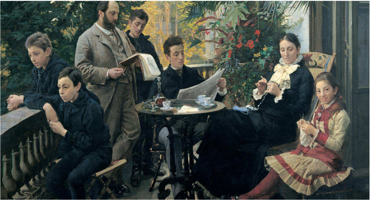
P.S. Krøyer, Hirschsprung familieportræt, 1881