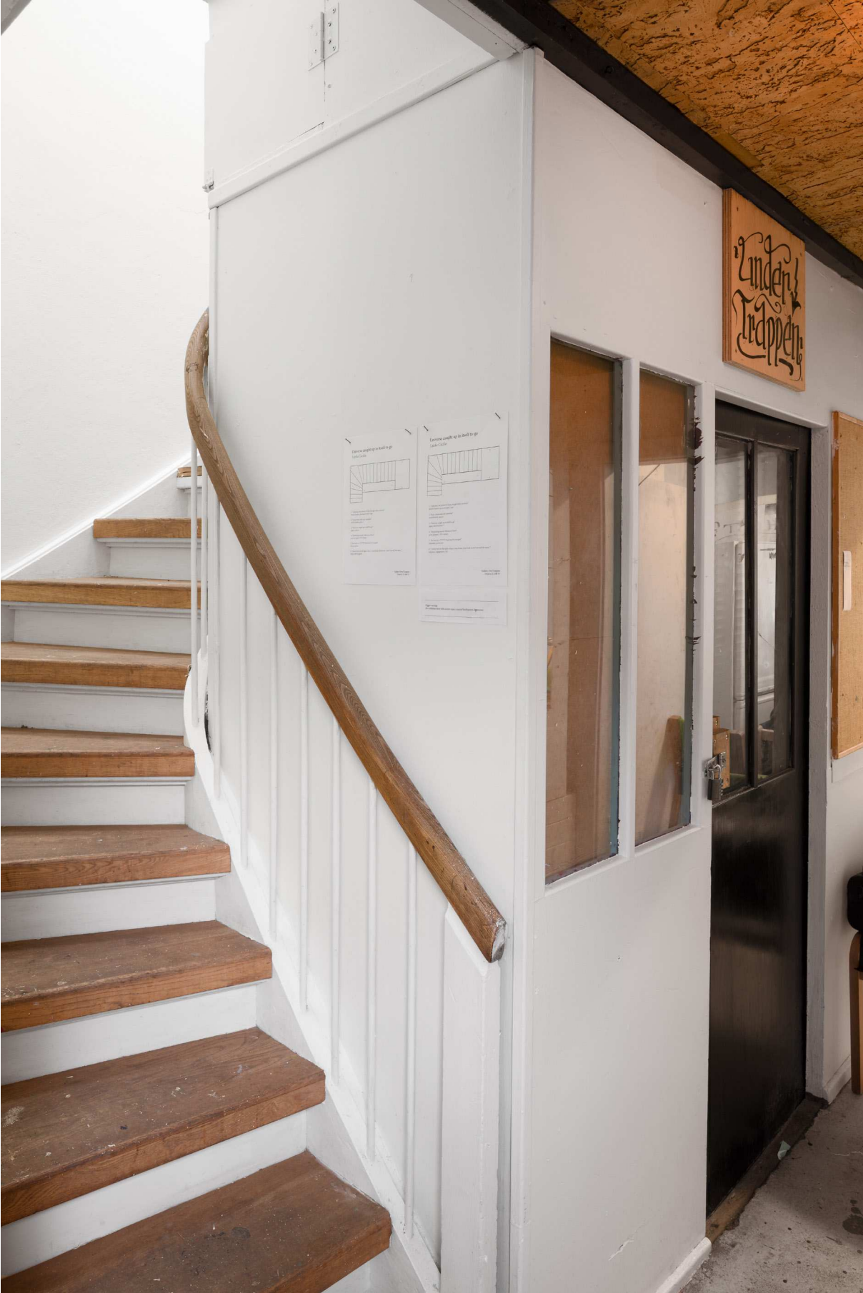
Indgang til Galleri OverTrappen