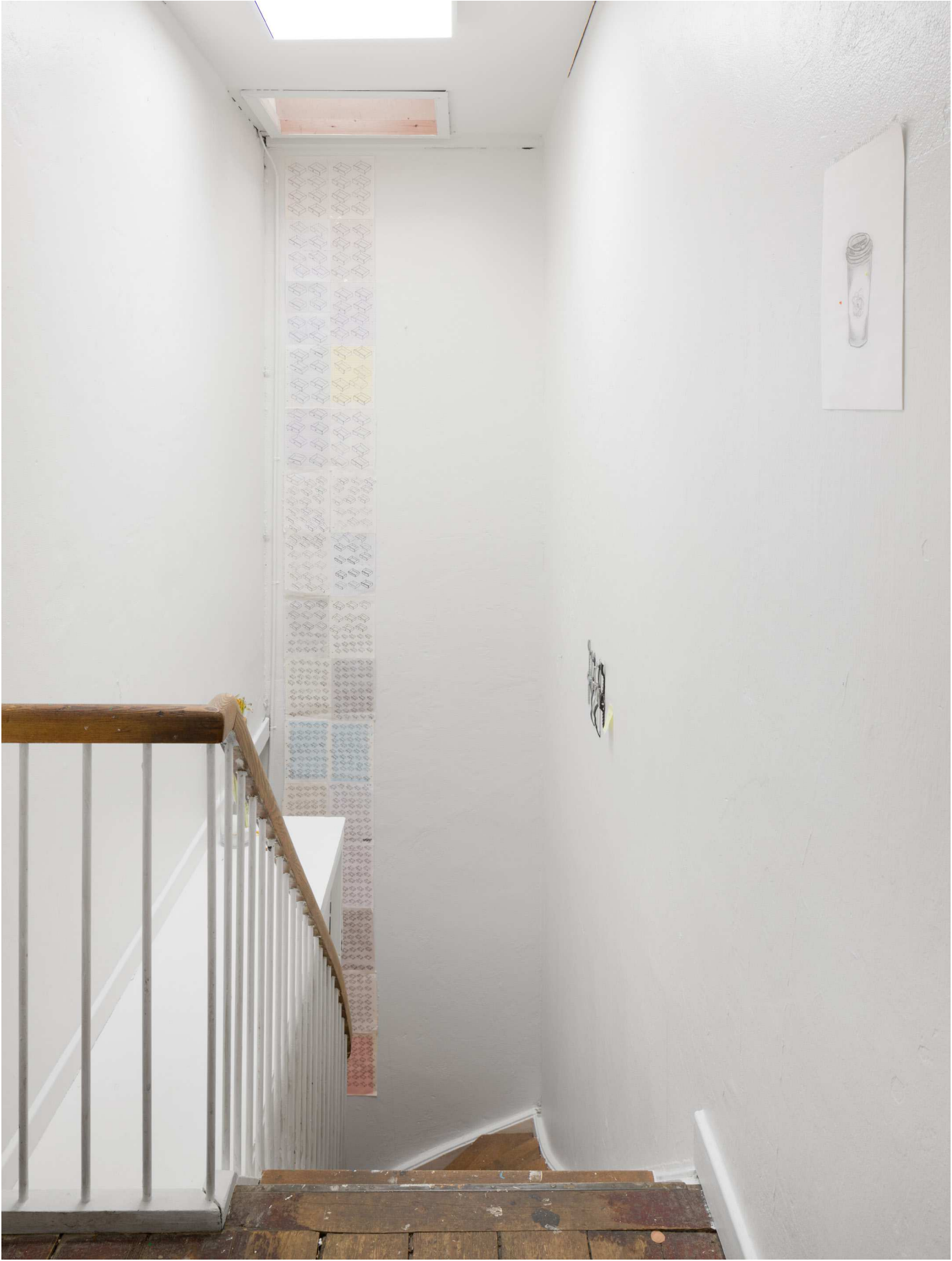
Oversigt over Galleri OverTrappen