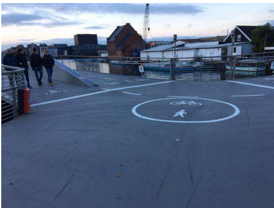
Sommerfuglebroen set fra Lejerbo-siden. Der er i dag opstribet adskillelse mellem gang- og cykelsti ude i krydset og der er markeret en "tavle" nede i belægningen, der skal fortælle, at dette broben er