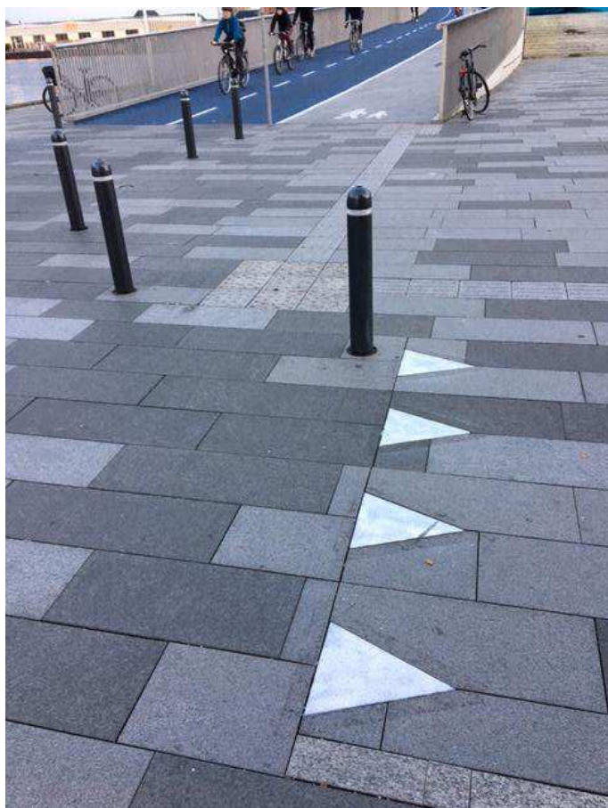
Havnegade ved Nyhavn og brolandingen.