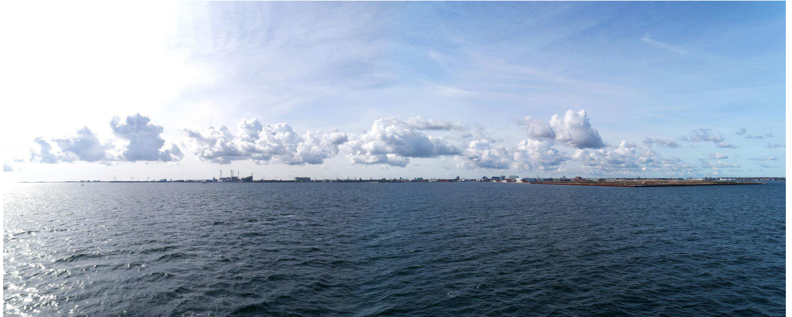
Figur 5 Fotostandpunkt 2 syd-sydvest - eksisterende forhold set fra Øresund.