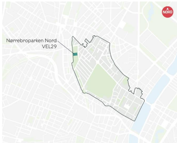
Afgrænsning af Korsgade Masterplan, og placering af projektet i Projektpakke 2021, som indgår i Korsgade Masterplan