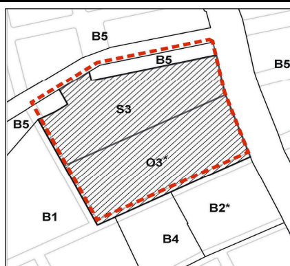
Kommuneplantillæg (område før) (område efter)