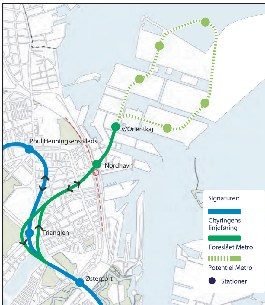
Nordhavnsmetroen. Linjeføringen for første etape, der er omfattet af kommuneplantillægget, er vist med mørkegrønt. Med stiplede lysegrønt er vist en mulig fremtidig udbygning og med blå, den allerede vedtagne Cityring.

Der er både økonomiske, miljø- og byplanmæssige fordele ved at etablere en afgrening til Nordhavn nu frem for senere. Det gælder eksempelvis lavere anlægsomkostninger, da der i forvejen arbejdes på Cityringen. Samtidig undgår man at gribe ind i Cityringens drift, hvilket vil være nødvendigt, hvis man vil bygge metro til Nordhavn på et senere tidspunkt. Naboer til byggepladsen ved Sortedamsøen slipper derudover for, at Sortedams Sø omdannes til byggeplads ad to omgange.