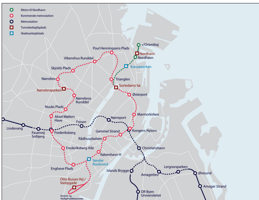
Fremtidens metronet med metro til Nordhavn.

Københavns Kommune er plan- og VVM-myndighed for anlægget og skal meddele bygherre en VVM-tilladelse, før projektet kan realiseres.