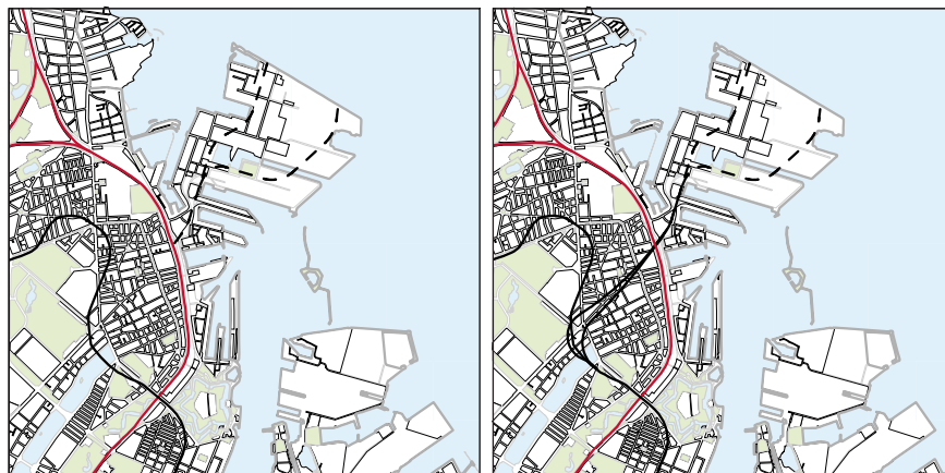
Tegningen viser de gældende retningslinjer i Kommuneplan 2011

Der kan anlægges en afgrening fra Cityringen til Nordhavn i form af en metro med to tunnelrør som vist på kortet. Metro til Nordhavn forbinder station v/Orientkaj og København H. Der kan etableres 2 stationer; en underjordisk station ved Nordhavn S-togs Station og en højbanestation ved Orientkaj, og en nødskakt i Krauseparken. Metroen kan anlægges som beskrevet i VVM-redegørelsen herfor.