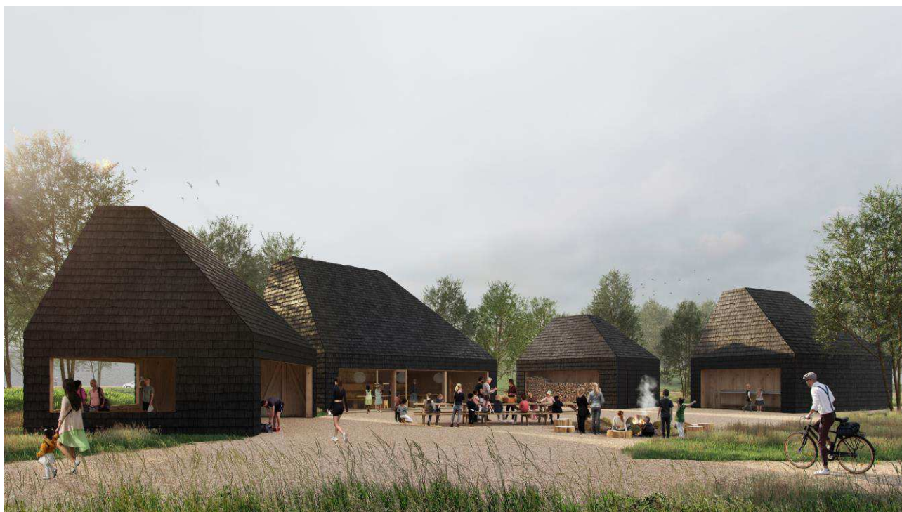
Foto: Visualisering af facilitet ved indgang nærmest DR-byen. © Grønborg & Møller.