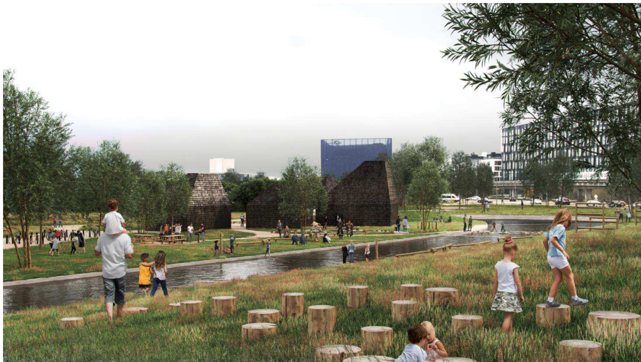
Foto: Visualisering af facilitet ved indgang nærmest DR-byen. © Grønborg & Møller.

I forbindelse med det endelige udbud af opgaven, har Teknik- og Miljøforvaltningen gennemført forhandlinger med tilbudsgiverne og der er foretaget visse mindre tilpasninger af faciliteterne (se dokumentnummer 2021-0143859-1), som dog ikke umiddelbart berører foreningernes ønsker.