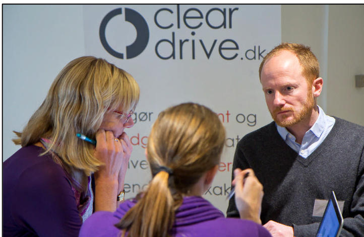
Netværksseminar i Transportnetværk Amager

Københavns Kommune har udtrykt ønske om at indsatsen indgår i Copenhagen Sharing, som et eksempel på hvorledes der laves kan konkret og fremadrettet miljøarbejde i de københavnske virksomheder.