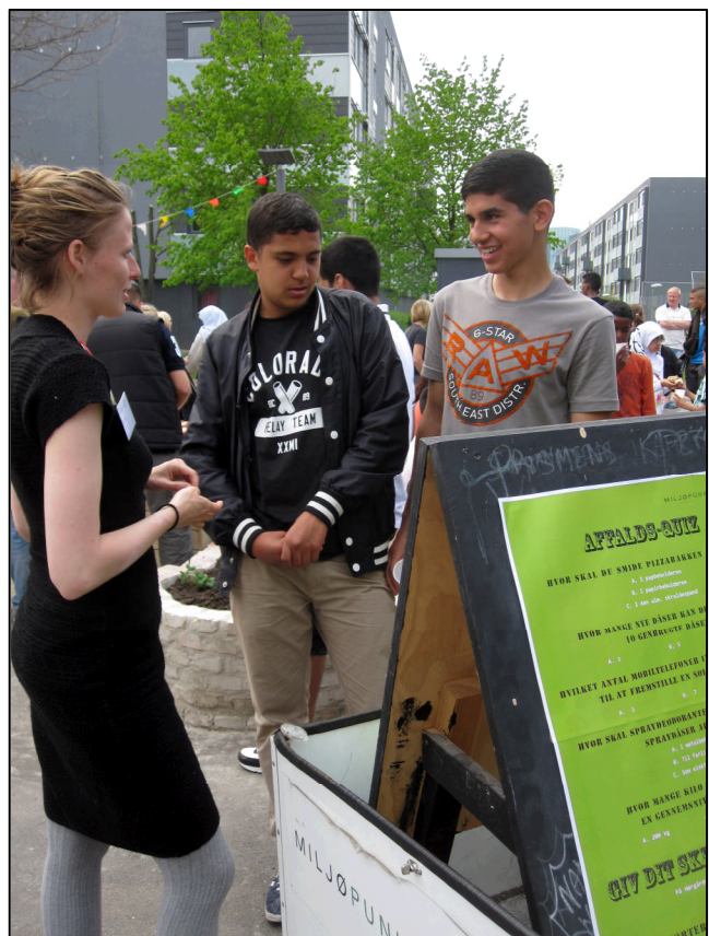
Affaldsquiz i Hørgårdens Nærgenbrugsstation

I september vil der i samarbejde med Sundholmskvarterets områdeløft blive afholdt et byttemarked på Peder Lykke Skolen.