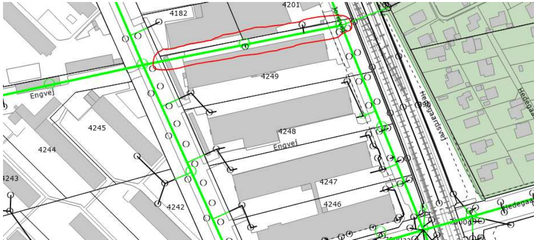
Figur 1 Markering af omtalte spildevandsledning – rød markering