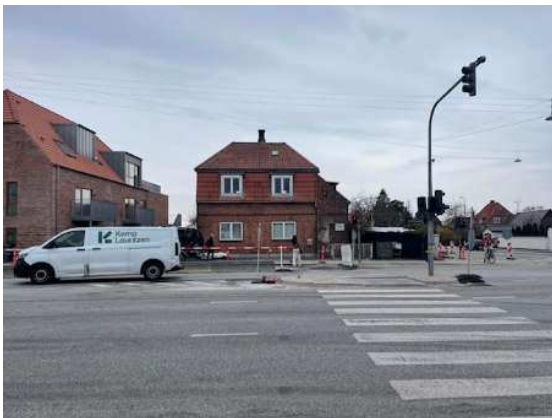
Foto af ejendommen april 2026

Den halve etage giver sig udtryk ved at facaden går helt op til 1.salens vinduesunderkant hvilket giver en forholdsvis høj mur i forhold til husets hovedproportioner. En kraftig vandret fuger over stueetagens vinduer og en lille meter under gesimsen, markerer etageadskillelsen mellem stue og 1. sal, og er vel et forsøg på at afbøde dette. En øvelse der ikke rigtig lykkes, og husets hovedproportioner forekommer ikke helt at være i balance, især ikke efter de oprindelige store vindues- og dørpartier er erstattet med murede blændingsfelter omkring mindre lavformat vinduer.