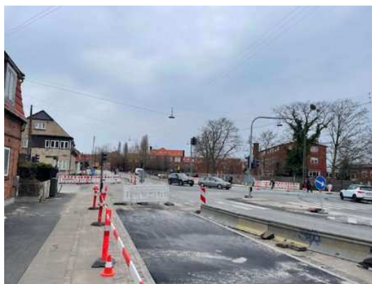
Udsigt fra ejendommen over Emdrup torv og langs Frederiksborgvej med ejendommen helt til venstre