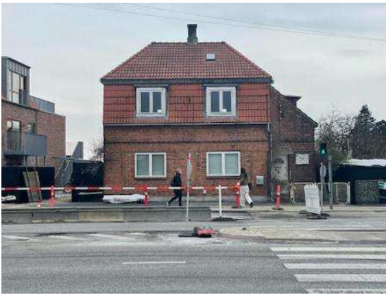
Foto af ejendommen april 2026