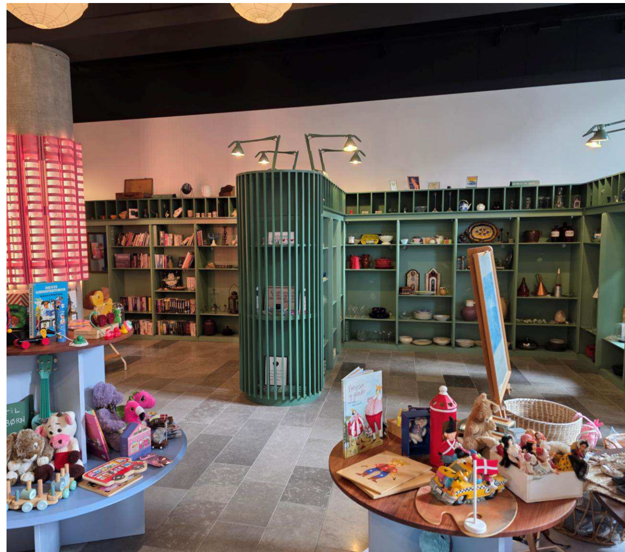
Kay Fiskers Plads Nærgenbrugsstation, Ørestad City, Amager Vest.

Hver nærgenbrugsstation betjener 20.000-40.000 indbyggere.