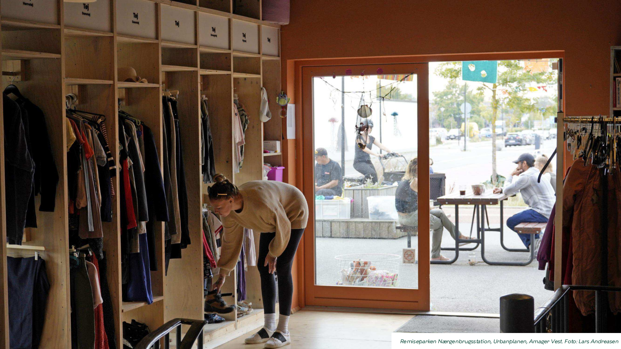
Remiseparken Nærgenbrugsstation, Urbanplanen, Amager Vest.