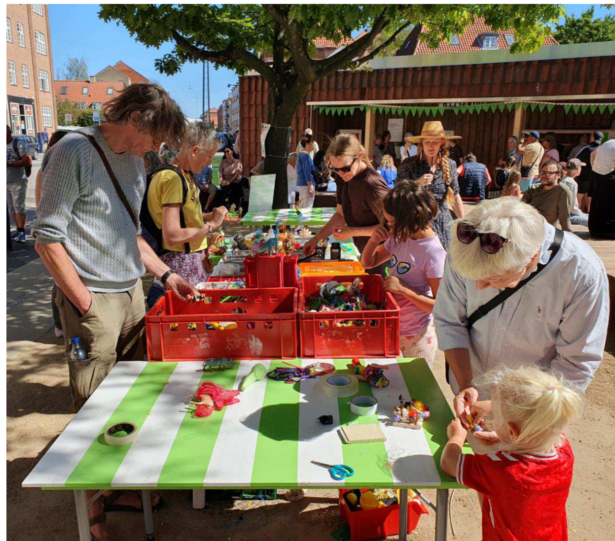
Helga Larsens Plads Nærgenbrugsstation, Vanløse.