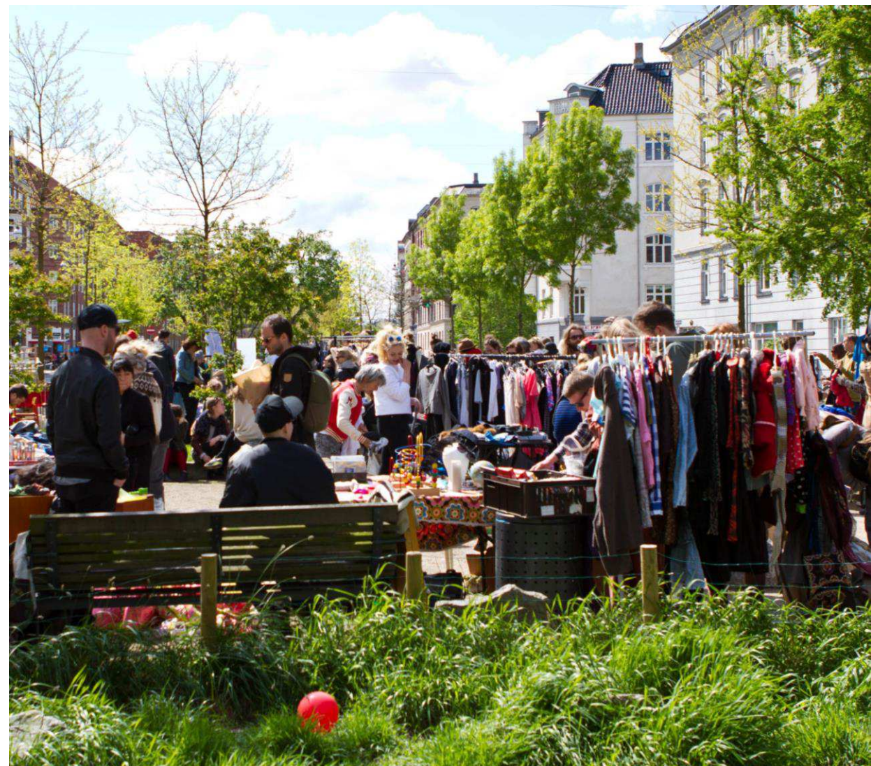
Loppemarked på Sønder Boulevard, Vesterbro.

Med deres lokale placering gør nærgenbrugsstationerne genbrug synligt og nemt tilgængeligt i hverdagen. Samtidig bidrager de til byens liv som bemandede og trygge opholdssteder, rummer gratis og inkluderende tilbud samt skaber mødesteder for fællesskaber om ressourcebevidst adfærd. På den måde er de både praktisk infrastruktur og en hjørnesteen i den genbrugskultur, som Ressource- og Affaldsstrategi 2030s skal styrke.