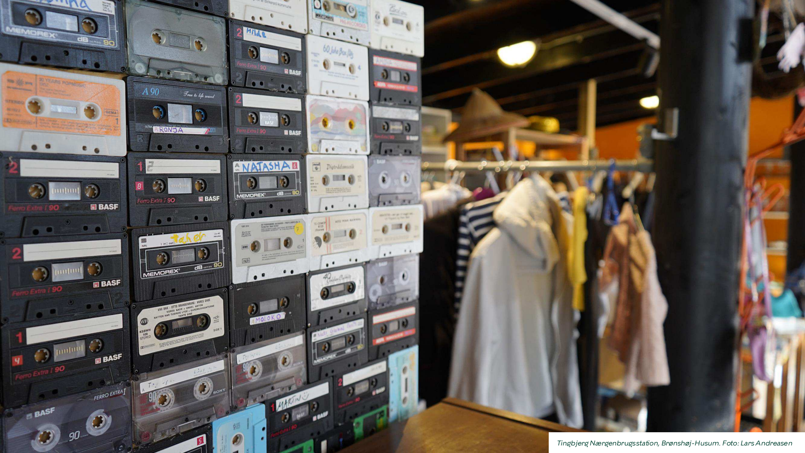
Tingbjerg Nærgenbrugsstation, Brønshøj-Husum.