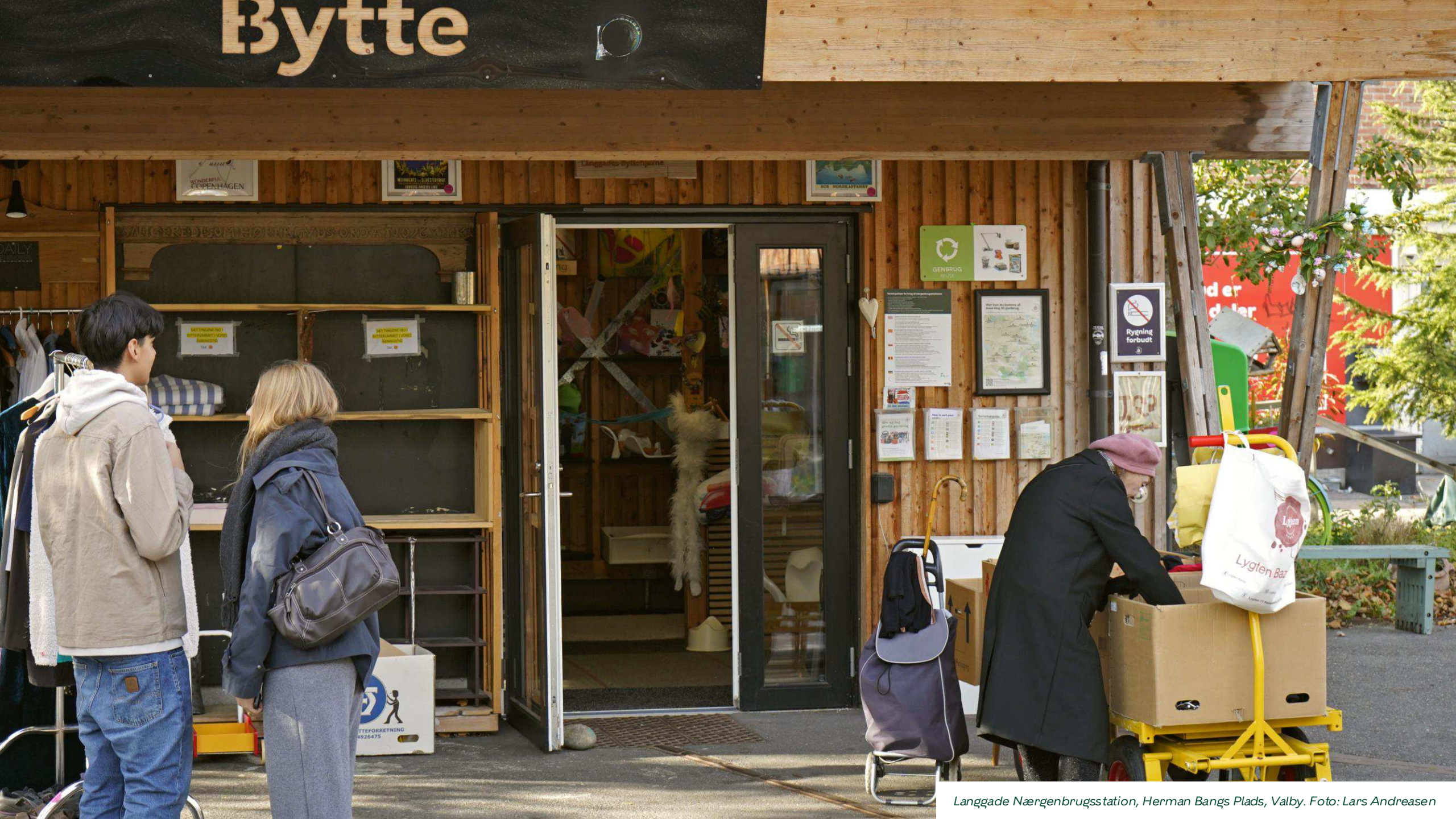
Langgade Nængenbrugsstation, Herman Bangs Plads, Valby.