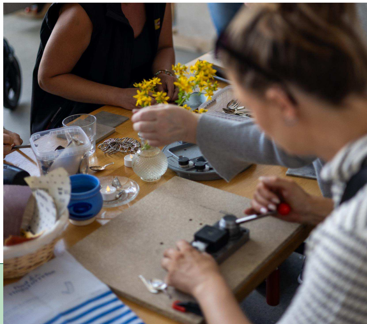
Sydhavn Genbrugscenter, Sydhavnen, Kgs. Enghave. Workshop om at lave smykker af bestik.

Gode fysiske rammer og nære partnerskaber med andre lokale aktører giver de bedste muligheder for læring, aktiviteter og frivillige lokale fællesskaber.