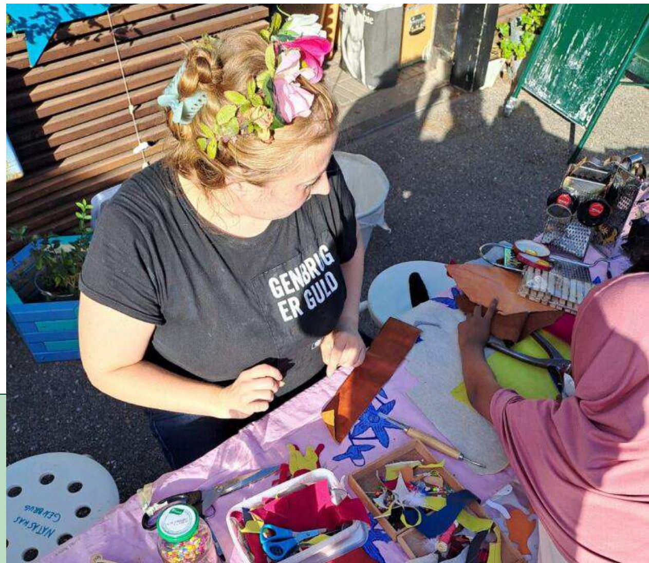
Tingbjerg Nærgenbrugsstation, Tingbjerg, Brønshøj-Husum. Workshop med genbrugstekstiler.

På nærgenbrugsstationerne styrker vi byens genbrugskultur og fremmer grøn dannelse via gratis aktiviteter om ressourcebevidst adfærd. Det kan fx være kreative workshops om reparation og upcycling eller familieaktiviteter, hvor man leger med genbrugsting.