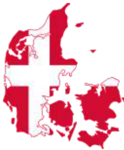
DenmarkStub2.svg Map of Denmark with flag.