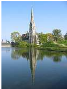
Eglise Saint Alban de Copenhagen 2.jpg Église Saint Alban de fr:Copenhague.Vue fr:nord-ouest.