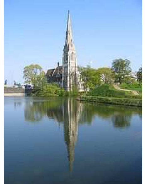
Churchillparken set fra Kastellet