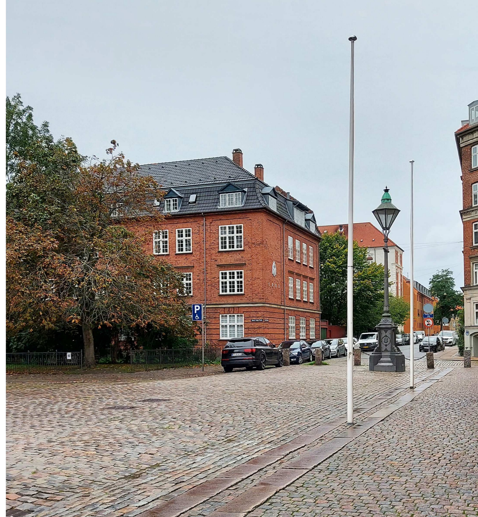
Billedet er taget fra Sankt Pauls Kirkeplads, og viser de gamle gadelampers originale placering op langs Sankt Pauls Gade, hvor der nu er wireophængte gadelamper.