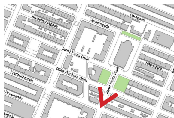
Eksiterende vs Nye Forhold: Skt. Pauls Plads set fra Adelgade.