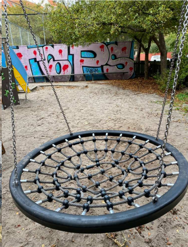
Legepladsens gyngetrænger til nye reb – ståltråde vil inden længe kunne ødelægge tøjet mm.