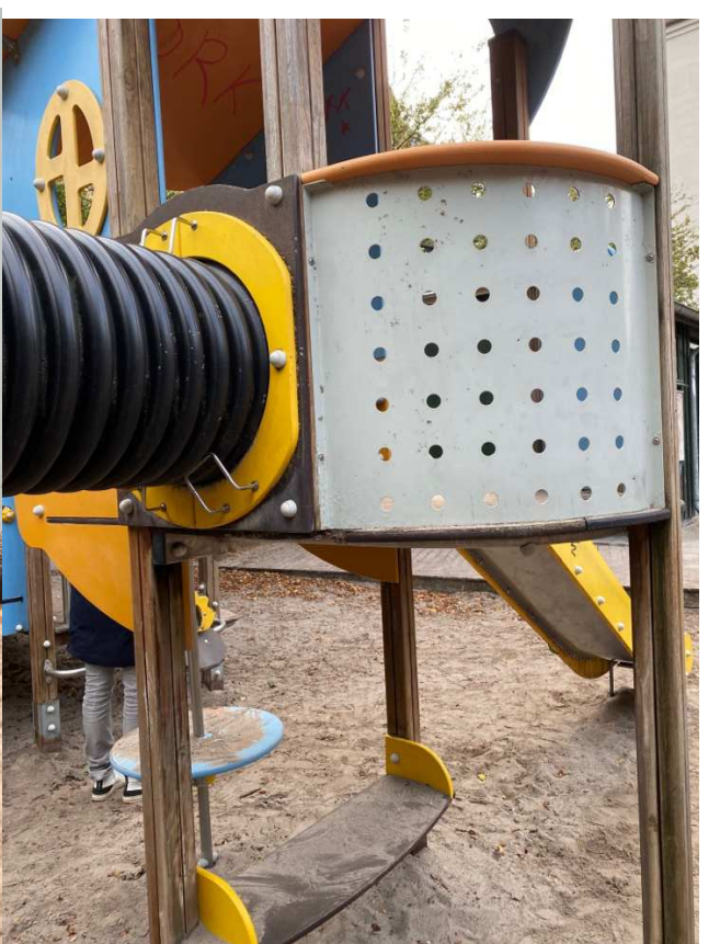
Legepladsens tårn m. ruchebane har fået skiftet 1 af 3 bundplader – inden længe er der behov for yderligere et bræt skiftes idet det smuldre.