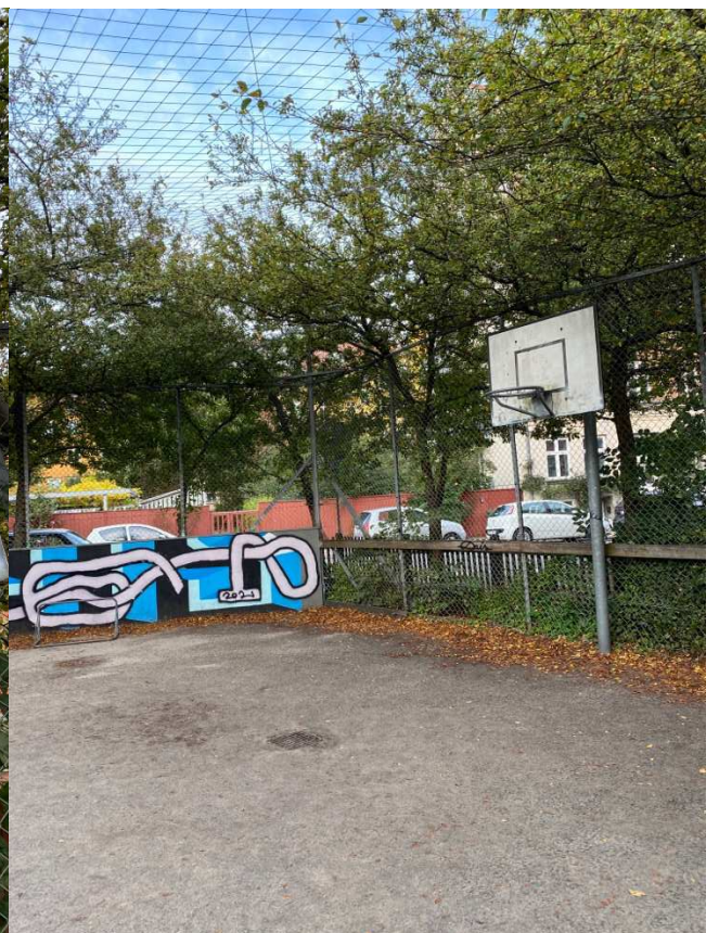
Legepladsens basket bane trænger til ny belægning, og et net til kurven.