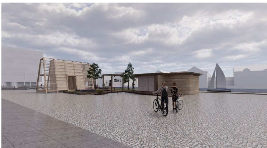
Figur 6: Rending af pavillon 1+2, Søren Kierkegaards Plads. Rending fra ansøgningsmateriale.

I byrummet kommer der til at afholdes mindre events med målet om at bringe opmærksomhed til, hvordan byggebranchen kan komme til at se ud i fremtiden.