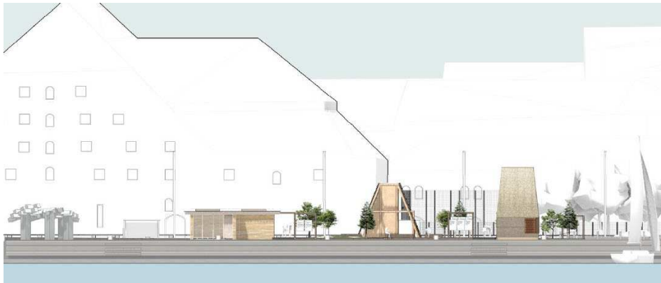
Figur 2: Illustrativt snit med Krigsmuseet og Christian IV's Bryghus i baggrunden. Illustration fra ansøgningsmaterialet.

Det midlertidige byrum er bygget op på tværgående retning af Søren Kierkegaards Plads. Et hævet trædæk vil fungere som centralt strøg, hvorudfra pavilloner kan tilgås niveaufrit. Den tværgående struktur bidrager til, at indsynet til Bryghuset opretholdes så meget som muligt, ved at placere den laveste pavillon tættest på Christian IV's Bryghus, og den højeste længst væk. Med en afstand på 10 meter mellem hver pavillon, skabes der sigtelinjer til Christian IV's Bryghus imellem pavillonerne.