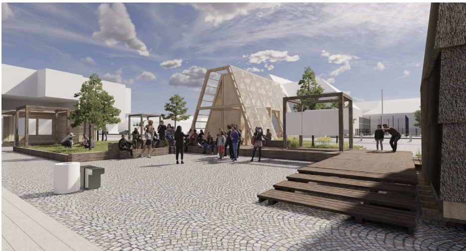
Figur 3: Visualisering af byrummets foramlingsområde indrammet af pavilloner. Visualisering fra ansøgningsmaterialet.