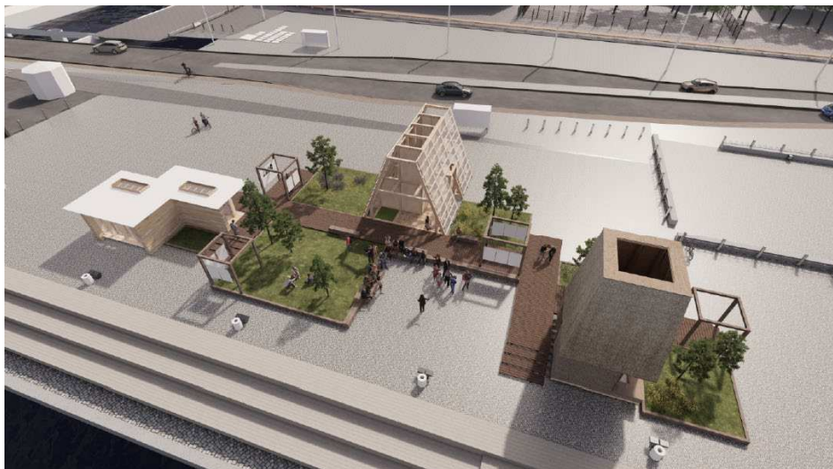
Figur 5: Rending af pavillon 3+1, Søren Kierkegaards Plads. Rending fra ansøgningsmateriale.

I byrummet kommer der til at afholdes mindre events med målet om at bringe opmærksomhed til, hvordan byggebranchen kan komme til at se ud i fremtiden.