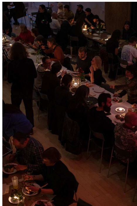
Community dinner på FOEG2025

Koncertforeningen er et non-profit foretagende og drives udelukkende af frivillige. Det overordnede ansvar for Koncertforeningens aktiviteter ligger hos foreningens bestyrelse, som består af fem musikentusiaster. Derudover tæller Koncertforeningen yderligere 12-14 kontingentbetalende medlemmer. I forbindelse med afholdelsen af Koncertforeningens hovedaktivitet, Festival of Endless Gratitude, engagerer Koncertforeningen yderligere 40-50 frivillige til afvikling af festivalen.