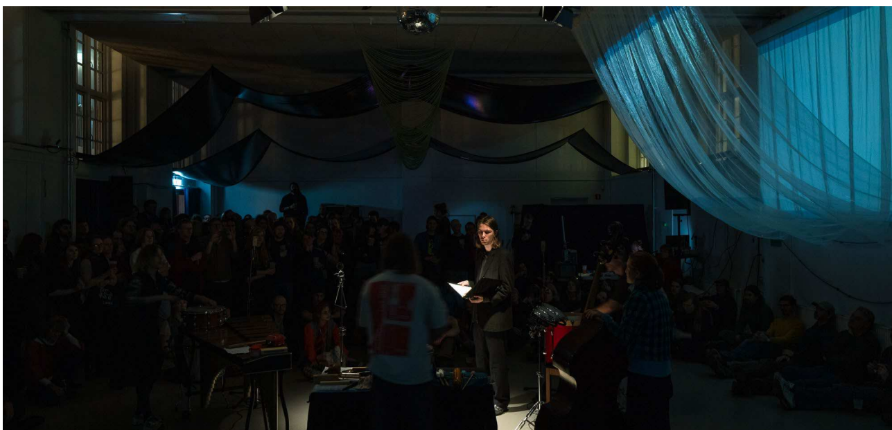
G-Bop Orchestra opfører "The Scott Walker Songbook" på FOEG2025

Koncertforeningen er en non-profit forening og drives udelukkende af frivillige. Foreningens kerneopdrag er at lave arrangementer i København med danske og udenlandske kunstnere uden at skele til kommercielle interesser og at kuratere ud fra musikalsk og kunstnerisk kvalitet, kant og relevans uden at skele til genrer. Koncertforeningen ønsker med alle sine aktiviteter at tilbyde et alternativ til den brede mainstream, der ofte er båret frem af og dybt præget af kommercielle interesser; et alternativ der er gennemsyret af høj, kunstnerisk kvalitet, nysgerrighed, fællesskab, åbenhed og med plads til eksperimenter.