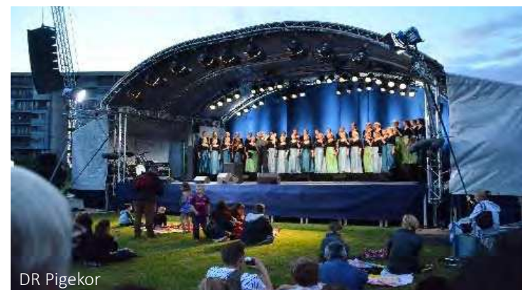
DR Pige kor