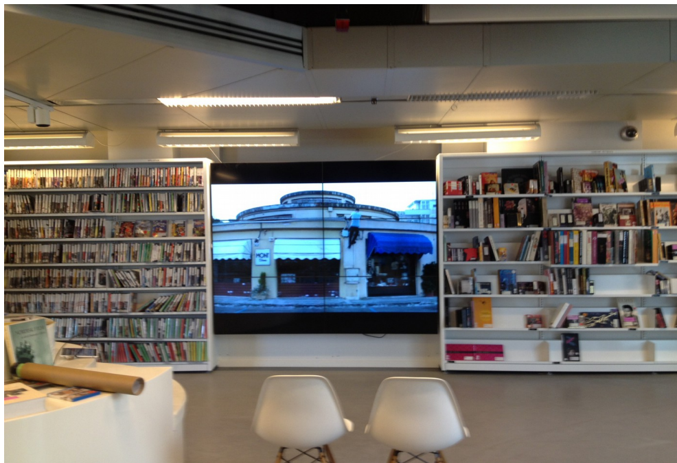
Projektion Installation ved Københavns Hovedbibliotek ved Krystalgade i 2013.