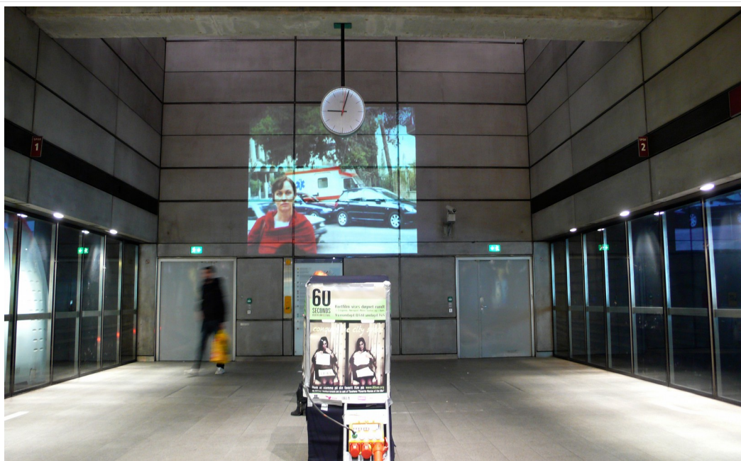
2013- "Conquer the City Space", projektion ved Nørreport Metro station.