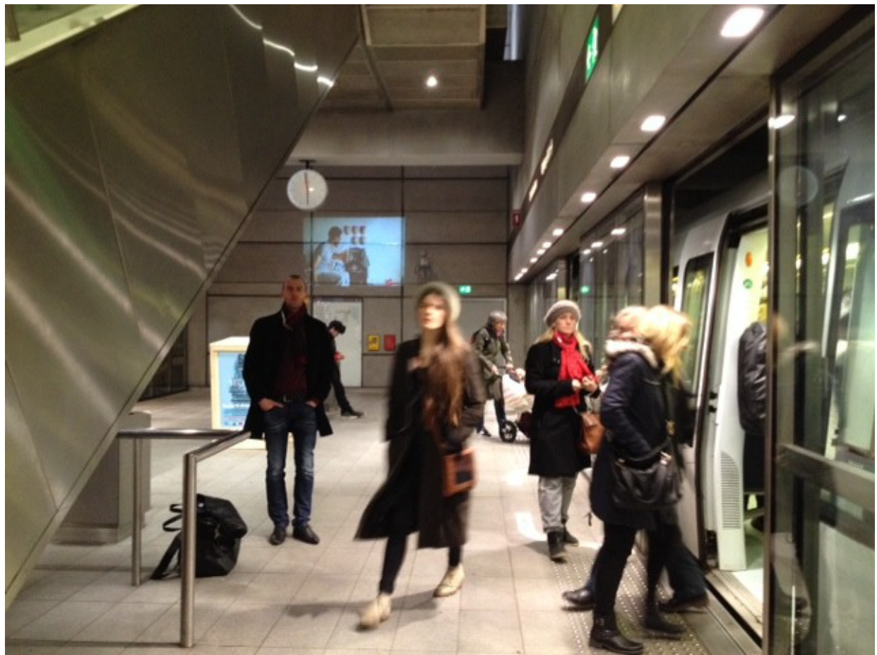
1. Foto fra perronen på Christianshavn station.