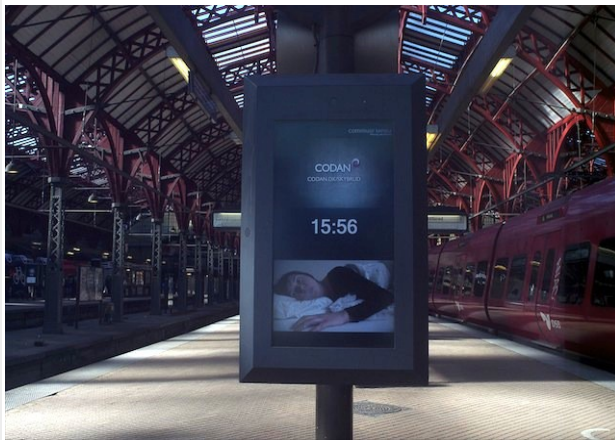
Københavns hovedbanegård perron 2013.