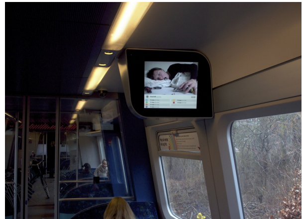
S-tog reklameskærme 2013.