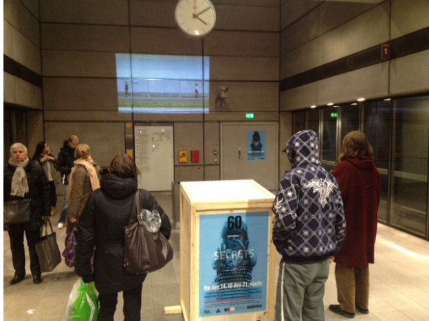
Christianshavn Metro station.