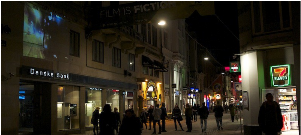
Street projektion: tema "Conquer the city space", 2013.