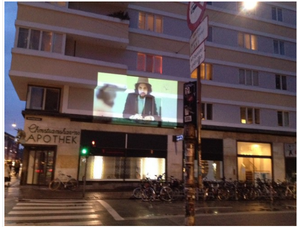
Gadeprojektion på Christianshavn Torv, 2014.