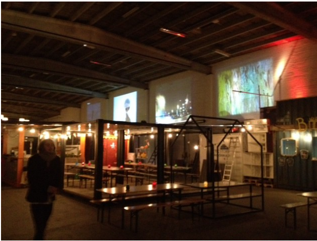
Kultumat event, Copenhagen Street Food, Papirøen 2014.